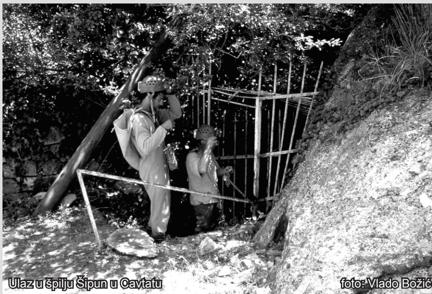
Ulaz u špilju Šipun u Cavtatu

U prospektu se najprije spominje grčki kralj Kadmo kao osnivač grada i bog Eskulap, ali tek kao natuknica. Tu se navodi da je grad osnovan pred 3 tisućljeća. U Enciklopediji leksikografskog zavoda (Grupa autora, 1966. i 1967.) navodi se da je Kadmo, sin feničkog kralja Agenora,