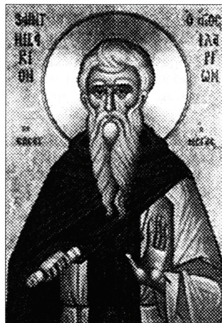
Sv. Ilar (preslika iz Zbornika župe dubrovačke, sv. III)

je motiv starih priča. Slična priča pojavila se i u navedenom prospektu 1978. vezana uz špilju Šipun, a također u članku Srećka Božičevića i Romana Ozimeca. Navodi se da je u borbi između Cezara i Antonija u I. st. p.n.e. Antonijev vojvoda Gaj Oktavije, rimski prokonzul u Makedoniji, bježeći pred Cezarovom vojskom koju je predvodio vojvoda Katije, u špilji Šipun sakrio neko blago (Božičević, 1979. i Ozimec, 2006.). Tu legendu više nije spominjao nitko drugi. Povijesni podaci o tom događaju za sada nisu pronađeni.