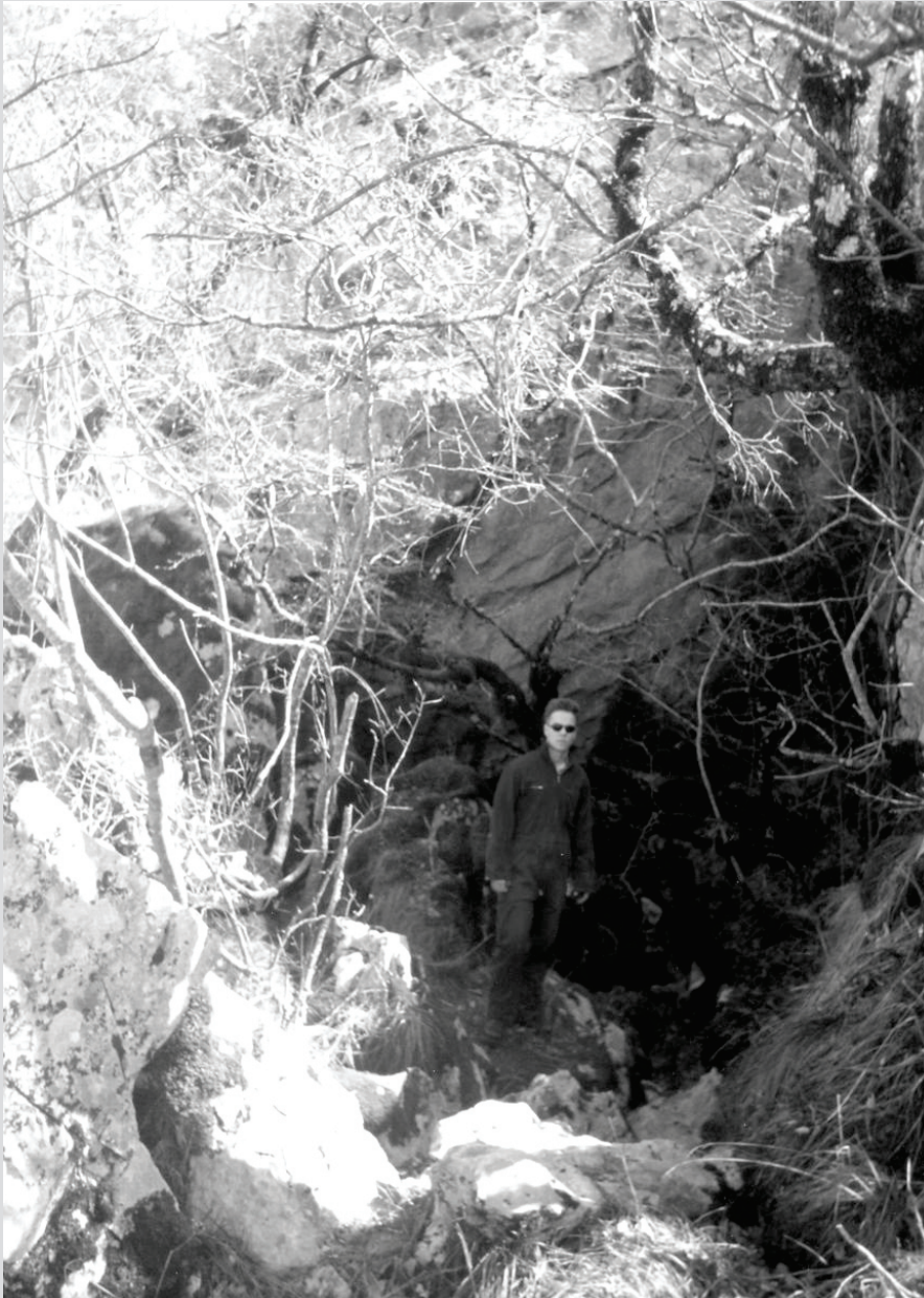
Ulaz u špilju Jezero na Snježnici