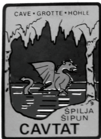
Naljepnice Zmaja i Eskulapa

U hrvatskom gradiću Cavtatu kraj Dubrovnika, nalazi se stotinjak metara dugačka i lako dostupna špilja Šipun poznata još od antičkog doba, a u brdu Snježnici u Konavlima Eskulapova špilja. O tim špiljama postoje legende, jedna se odnosi na zmaja Voaza u špilji Šipun, jedna na blago zakopano u špilji Šipun a jedna na zmiju-zmaja u Eskulapovoj špilji. Rimski grad Epidaurum, na čijim se ostacima danas nalazi grad Cavtat, prvi spominje Rimski pisac Plinije Stariji, a zmaja u Epidaurumu sv. Jeronim. O špilji Šipun i tim legendama u kasnijim stoljećima pisali su Jakov Sorkočević, Nikola Gučetić, Serafin Razzi, Trogiraniin Lucius, Franjo Appendini, engleski pisac Evans i mnogi drugi. Te legende najstariji su zapisi o nekoj određenoj špilji u Hrvatskoj. Godine 1978. špilja Šipun je bila uređena za turističke posjete, a sada se čine naponi da se špilja, zapuštena tijekom Domovinskog rata, opet obnovi i osposobi za turističke posjete.