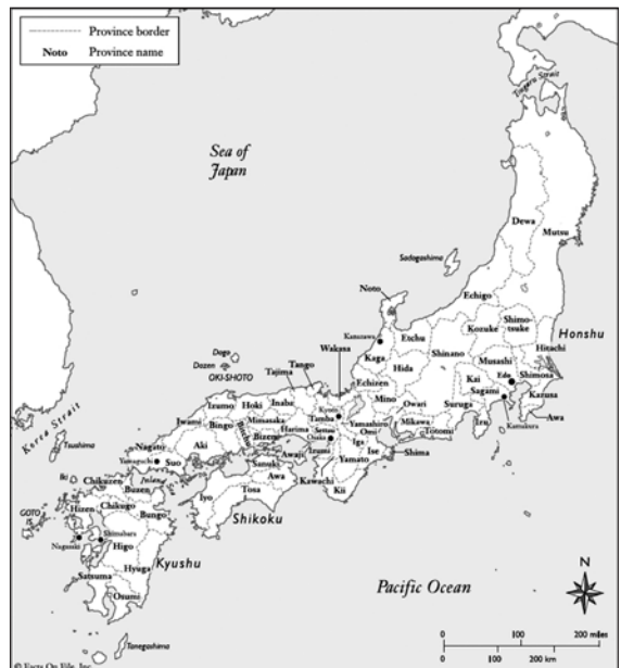
Slika 1. Prikaz sustava provincija

Zanimljivo je kako su sva trojica ujedinitelja bili u međusobnome doticaju, na istoj strani ili u savezništvu. Oda Nobunaga i Tokugava Iejasu bili su saveznici, a Tojotomi Hidejoši služio je Odi Nobunagi. Zašto je to tako? Naime klan Oda i klan Tokugava nalazili su se na strateškome trgovačkom i prometnom putu Tokaidu, u južnome obalnom dijelu središnjega Honšua. Isto tako bili su zaštićeni planinskim lancem, kroz koji je prolazio planinski put Nakasendo, sjevernije od Tokaida. Oba puta spajala su današnji Tokio i Kjoto. Osim geografskih značajki trojica ujedinitelja reformirali su japansko ratovanje u kojemu je glavni fokus bio na ašigaru jedinicama, koje su se za razliku od samuraja borile u čvrstim formacijama s kopljima i arkebuzama. 10 Tako je Tokugava Iejasu stekao svu vlast i mogućnost da popravi situaciju u svojoj zemlji.