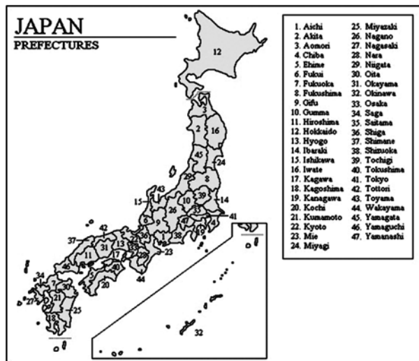
Slika 4. Prikaz japanskih prefektura

Zabranjeno im je nošenje mačeva i pundi, njihovih statusnih simbola. Velik broj samuraja stekao je „moderno“ obrazovanje te su se zaposlili u državnim tijelima, a neki su se upustili u kapitalističke vode. 49 S druge strane neki su samuraji bili protiv reformi koje je donosio carski dvor, a centralizacija države i oduzimanje privilegija bili su kap koja je prelila čašu. Već spomenuti Saigo Takamori povukao se u svoju provinciju Sacumu te je uspio okupiti nezadovoljne samuraje 1876. godine. Opravdavali su se kako se oni nisu borili za takav Japan te su smatrali da su izigrani, iskorišteni i izdani od carskoga dvora. Isto tako odbijeni su Takamori-jevi savjeti da se napadne Koreja.