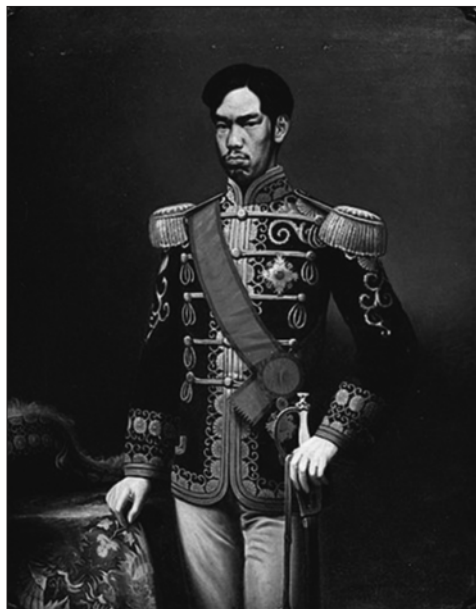
Slika 3. Car Meiđi

Bivši šogun Jošinobu očito je bio spreman za svoju novu, nižu poziciju, ali njegovi sljedbenici u središnjemu i istočnome dijelu otoka Honšua nisu imali iste namjere. Nakon što mu je oduzeta zemlja šogunatske snage predvođene provincijama Aizuom i Đozaijem organizirale su svoju vojsku od 10 000 ljudi. Uvidjevši kako su ga carske snage potpuno otpisale, Jošinobu preuzima zapovjedništvo nad vojskom te se 27. siječnja 1868. godine sukobljava s carskom vojskom kod Tobe-Fušime. 40 Iako je imao tri puta brojniju vojsku, koja je djelomično uvježbana od francuskih savjetnika, carske