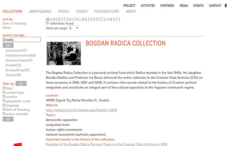
Primjer pretraživanja zbirke u Registru