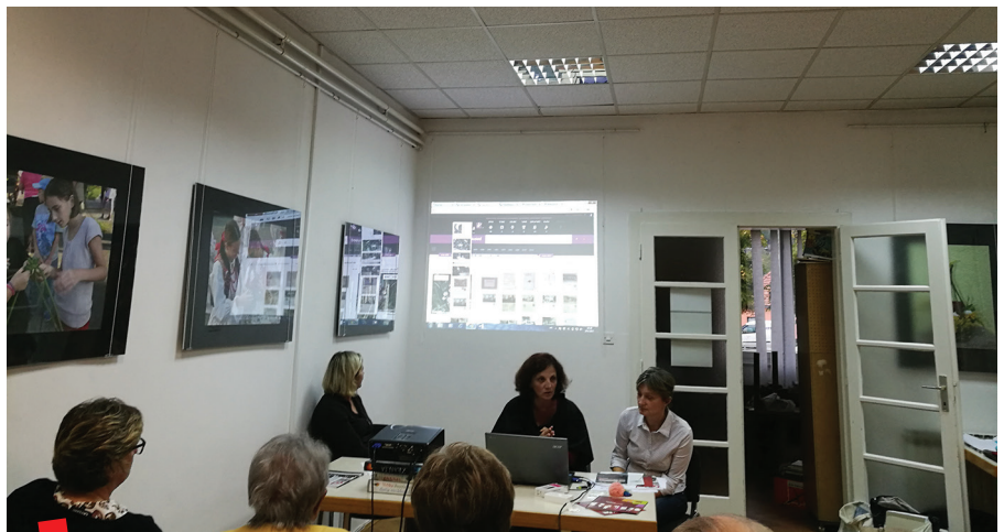
Predstavljanje i otvaranje Topoteke Podsused u Knjižnici Podsused u rujnu 2017.

Podsused, Kapela sv. Martina oko 1900.