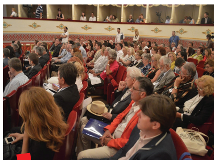
Gospodarski forum na Drugom hrvatskom iseljeničkom kongresu u Šibeniku 2016., Hrvatsko narodno kazalište

Hrvatske, a pomoć u organizaciji skupa su Centru za istraživanje hrvatskog iseljeničtva i Centru za kulturu i informacije Maksimir pružili i Institut društvenih znanosti Ivo Pilar, Ravnateljstvo dušobrižništva za Hrvate u inozemstvu, Hrvatska matica iseljenika, Institut za migracije i narodnosti, Hrvatsko katoličko sveučilište u Zagrebu, Nacionalna i sveučilišna knjižnica, Hrvatski državni arhiv, Društvo hrvatskih književnika, Hrvatska gospodarska komora, Centar hrvatskih studija sa Sveučilišta Macquarie iz Australije, Udruga Domovinska i iseljenička zajednica te Azijsko-pacifička gospodarska komora. Veliku podršku ovakvom događanju pružili su i grad Šibenik, Turistička zajednica grada Šibenika i Hrvatska gospodarska komora Šibensko-kninske županije i brojne druge lokalne institucije.