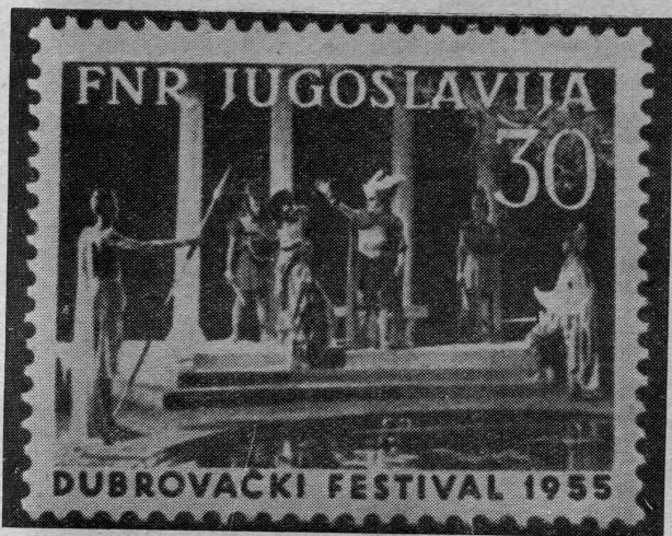
Prizor „San Ljetne noći“ u parku Gradac

Na poticaj i zalaganje sada pok. Jova Bravačića zasnovan je i obrazovan današnji filatelistički kolektiv pod imenom »Filatelistički klub Dubrovnik«, i to kao kontinuitet već postojeće filatelističke tradicije u Dubrovniku. Klub tada nije imao svojih prostorija, već su se njegovi članovi sastajali po privatnim kućama, da u veselu društvu i u časovima odmora nađu najbolju razonodu i zabavu baš kroz rad na polju filatelističke aktivnosti.