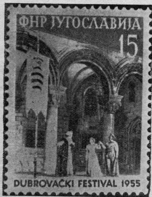
Prizor „Robinja“ pred Kneževim dvorom