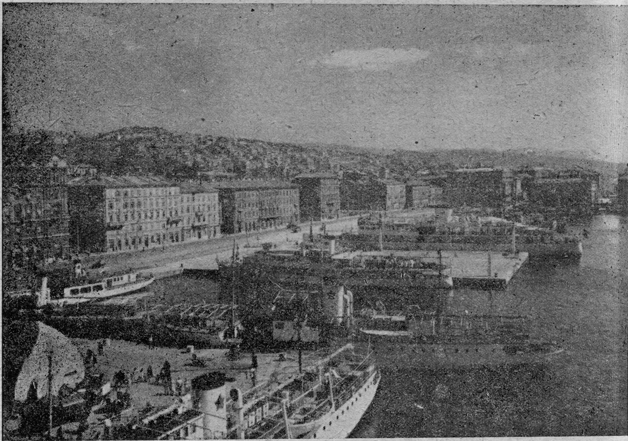
Rijeka naša najveća pomorsko-trgovačka luka

Na kraju su donesene i sankcije za neprimjeravanje odredaba ove uredbe. Kazne iznose 10.000.— dinara globe ili 30 dana zatvora, a ako je u pitanju sportska ili druga organizacija i do 100.000.— dinara. Može biti izrečena i zaštitna mjera zabrane udaljavanja strane jahte iz našeg obalnog mora.