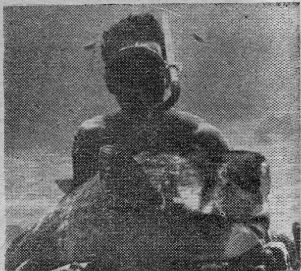
Podvodni lovac sa uhvaćenim plijenom

»Morski psi su mnogima od nas bili cilj strastvenog lova. Ovaj lov, kao i svaki lov na veliku ribu, zahtijeva da na harpunu bude vezan jedan plovak. Plovak mora biti dosta velik i na dovoljno dugačkoj i čvrstoj uzici. Kod manjih morskih pasa može to biti jači najlon, ali kod većih, uzica za plovak mora biti čelična.