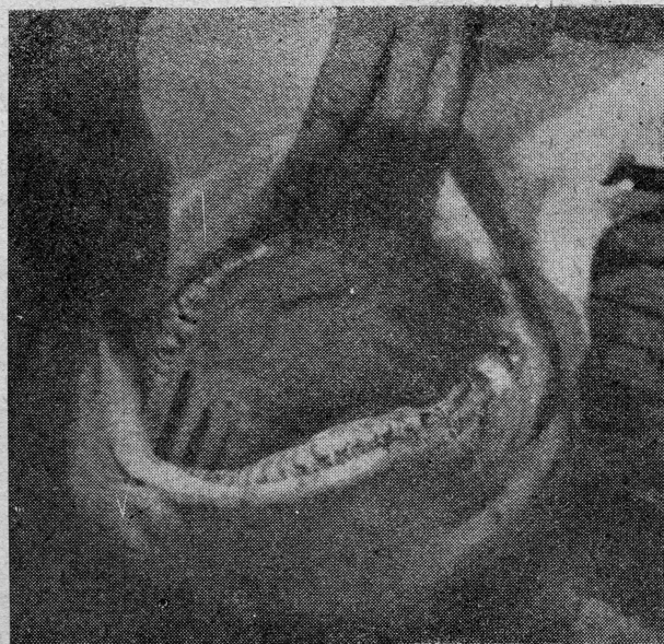
Trostruki redovi zubi jednog morskog psa uhvaćenog podvodnom puškom. Morski pas ne žvaće, hvata i guta

Ustanovili smo da se vrlo rijetko morski pas približava čovjeku s lica. Mnogo više voli da se približi s leđa. Približava se šutljiv, oprezan sa žutim očima fiksno uperenim u glavu čovjeka, ali vrlo rijetko napada. Oči mu slične očima mačke. Što se tiče nas, mi nismo nikad bili napadnuti. Mnogo puta smo doživjeli, da nas promatraju dva nepokretna žuta oka iza leđa, a čim bi se brzo okrenuli, mogli bi primjetiti na dva metra od nas gubicu životinje, koja je imala dva, a ponekad i do pet metara duljine. Definirati osjećaj, koji čovjek tada ima, teško je. Morski pas ima monstrozno izgled. Ipak, a to nam kaže iskustvo, moglo bi se reći da čovjek pred sobom ima pomalo plašljivu, ali opaku životinju, a ne divlju zvijer kakvom se morskog psa obično prikazuje. Ovo naravno ne vrijedi za sve slučajeve, ali mi smo ih tako doživjeli u Crvenom Moru.