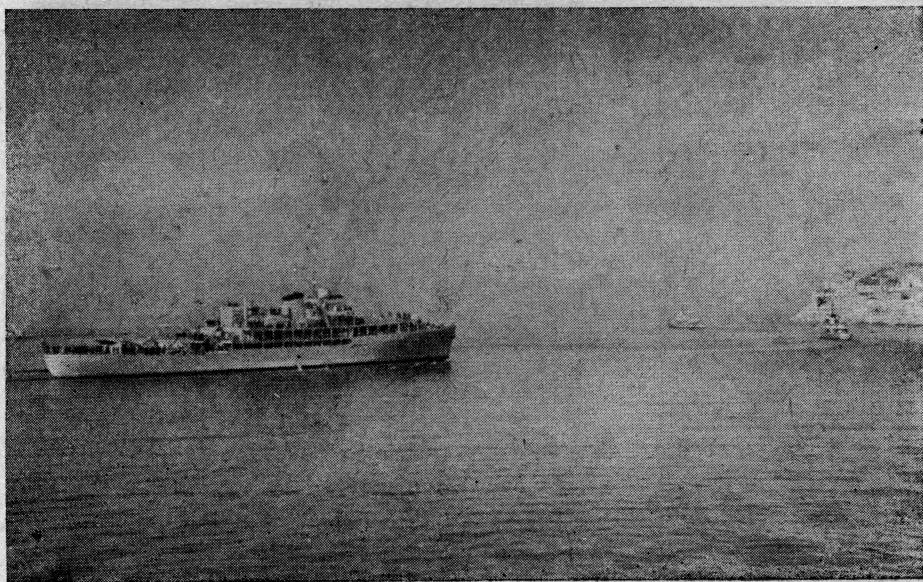
„Galeb“ na povratku u domovinu prilazi našoj obali

I u Pireju, kao i u Aleksandriji, bili smo tri dana. Već prvog dana po uplovljenju, dvije veće grupe pitomaca i ofi-