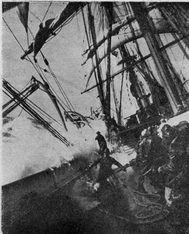
„Dar Pomorza“ u jednoj jačoju oluji

Prema novom programu za izobrazbu kadrova nautičkog smjera predviđa se, da đak nakon završene škole mora