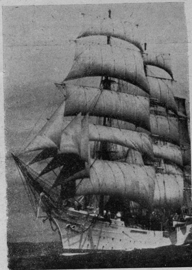
Poljski školski brod „Dar Pomorza“, plovi punim jedrima

Kao jedrenjak, brod je uglavnome namijenjen za školovanje đaka, nautičkog smjera, zato je opremljen s najmodernijim navigacionim instrumentima i pomagalima. Posjeduje Gyro-kompas tipa Sperry Gyroscope, koji povezan s električnim brzinomjerom tipa Chernekeef-log automatski upisuje kurs na diagramu kursografa. Nadalje ima električni dubinomjer na jeku Hugheset son MS — 12 Echo Sounder, te radar tipa General Electric i radiogoniometar.