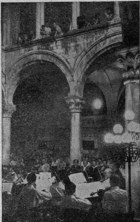
Koncert u atrijumu Kneževa Dvora u Dubrovniku

DRAMA Teško se može bilo što prigovoriti izboru dramskih djela uvrštenih u festival. Sedam drama u sadržajnom rasponu od tragedije do lakrdije, uz dva domaća autora, rješenje je koje izaziva priznanie ljudima koji su ga donijeli. Shakespeareov »Hamlet« i Sofoklov »Kralj Edip«, Corneilleov »Le Cid«, Goetheova »Ifigenija na Tavridi« i Vojnovičev dramolet »Na taraci«, te dvije komedije, Goldonijeve »Ribarske svađe« i »Jovadin« nepoznatog dubrovačkog pisca, — djela su, koja uz dobre scenske postavke mogu oduševiti gledaoca. Zanimljivo je, da je od 7 drama izvedenih ove godine na Ljetnim igrama 4 izveo festivalski ansambl i ako se to pokaže kao orijentacija prema samostalnosti Igara, možemo samo pozdraviti tu inicijativu. Ova je naime godina pokazala, da djela postavljena samo za festival i izvedena od ekipa kakve ne može dati samo jedna kazališna kuća, postižu mnogo veći uspjeh od onih, koja se naknadno adaptiraju na novi scenski prostor. Sofoklov »Edip« i »Jovadin« bile su zato naislabije predstave, dok su se »Ribarske svađe« nekako izvukle spretnošću režisera, koji je kazališni dekor jednostavno umetnuo u gradsku luku, te je predstava izvedena kao u kazališnoj kući. A ipak ne možemo reći da su to bile loše izvedene predstave. Dugo ćemo se sjećati Ljubiše Jovanovića u ulozi Edipa, Pera Kvirgića kao Jovadina i Emila Kutijara kao paron Tonija u Ribarskim svađama, ali ipak u sve 3 predstave naći ćemo nešto što ih stavlja ispod onih, festivalskog ansambla. Kod