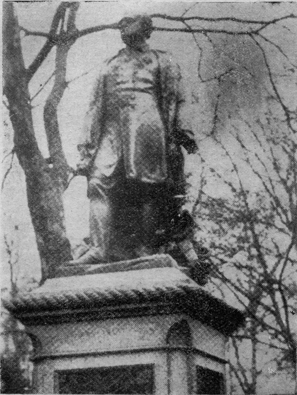
Spomenik Johnu Franklinu i njegovim mornarima

s raznim stvarčicama, koje su mislili zamijeniti kod Eskima za hranu. Iscrpljeni od glada i umora napustili su saonice.