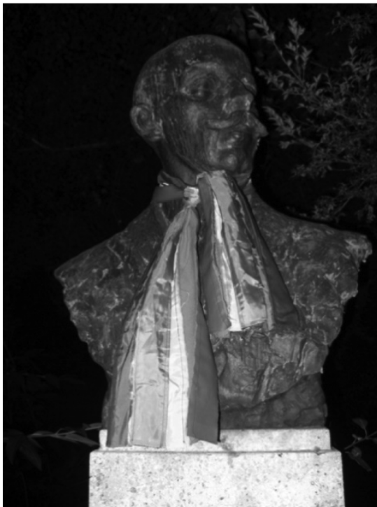
Fotografija 3: ukrašena bista iz noćne akcije kugA-e 2008. godine

Kao što postuliraju Berlant i Freeman, s komunikacijskim kanalima koji se odnose na kupovinu i konzumerizam, pa tako i na trgovačke centre, povezujemo ideju “obiteljskog okruženja”, okruženja koje “stvara nostalgичnu sliku centra grada kao čistog i sigurnog mjesta” (Berlant i Freeman 1992: 167). Istupajući kao queer u trgovačkim centrima i na jumbo plakatima, queer populacija remeti njihovu antiseptičku aseksualnu površinu, 23 “kontaminira” ih. Na isti se način mogu opisati akcije kolektiva kugA – kulturno-ulične gej Akcije. Naime, 2008. godine povodom Dana izlaska iz ormara kugA je ukasila dvadesetak bista u centru grada maramama duginih boja, a 2009. godine je šest gradskih fontana obojila bojama iz duginog spektra koje čine LGBT zastavu (fotografije 3 i 4).