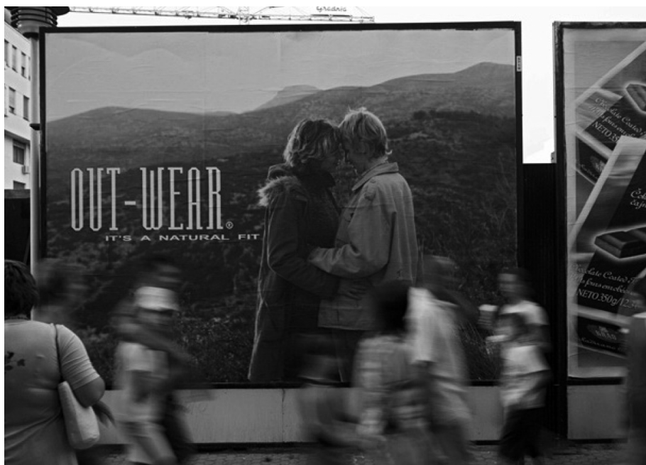
Fotografija 2: plakat iz serije Lezbe, aktivistička intervencija umjetnica Helene Janečić i Ane Opalić