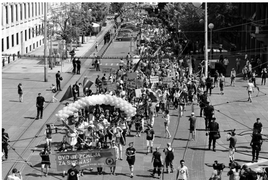
Fotografija 6: Povorka 2013. godine, kao odgovor na referendum o uvođenju definicije braka u Ustav

jedna od predstavnica udruga civilnog društva u radnu je grupu bila pozvana i aktivistica iz Zagreb Pridea. Rasprava oko donošenja tog Zakona izazvala je veliku mobilizaciju građanstva. Naime, te je godine nova, uvjetno rečeno lijevo orijentirana vlada, sukladno svom predizbornom programu trebala uvesti više relevantnih promjena u obiteljske politike: osim Zakona o životnom partnerstvu, raspravljalo se i o Zakonu o medicinski potpomognutoj oplodnji te o uvođenju zdravstvenog i građanskog odgoja u škole. Provocirajući teme koje proizlaze iz organizacijskih koncepata poput “života” i “obitelji”, nova je vlada vrlo brzo navukla na sebe gnjev Crkve i klerikalnih organizacija, udruga i inicijativa, a rasprave oko uvođenja novih zakona prerasle su u višegodišnji verbalni rat između Vlade i Crkve koji je svoj vrhunac doživio upravo uoči rasprave oko donošenja Zakona o životnom partnerstvu. No, uplitanje Crkve u javne politike i njezino širenje mržnje prema LGBTIQ zajednici izazvalo je revolt velikog dijela građanstva, koje je 2013. godine na Povorci ponosa u većem broju nego ikada dotad iskazalo podršku queer zajednici (fotografija 6), kojoj su određene klerikalne udruge i inicijative željele uskratiti prava unošenjem definicije pojma “brak” u Ustav. Kao što navode Shore i Wright (1997), riječ je o stvaranju još jednog organizacijskog koncepta u režimima upravljanja populacijom.