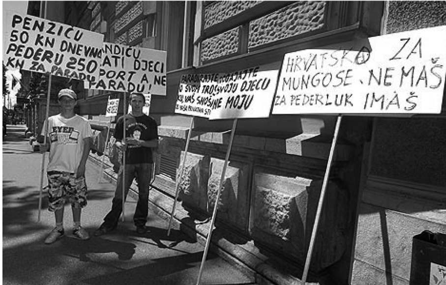
Fotografija 5: prvi protuskup Povorci ponosa

dali naslutiti kako bi se situacija glede Povorke mogla razvijati u godinama koje slijede. Naime, za vrijeme trajanja Povorke 2005. godine događa se prvi protuskup. Tada grupa ljudi na Zrinjevcu, mjestu odakle je Povorka kretala i gdje je završavala, ističe transparente kojima negoduje zbog visokih troškova “gay parade” (vidi fotografiju br. 5).