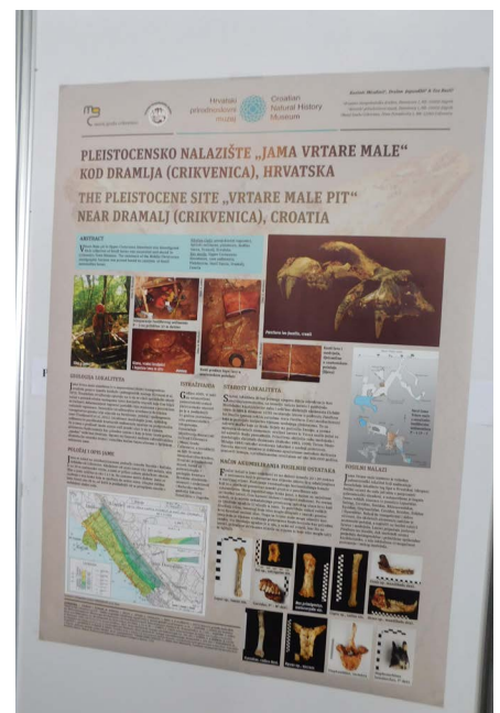
Neki od postera geospeleološke i paleontološke tematike prezentirani na Kongresu