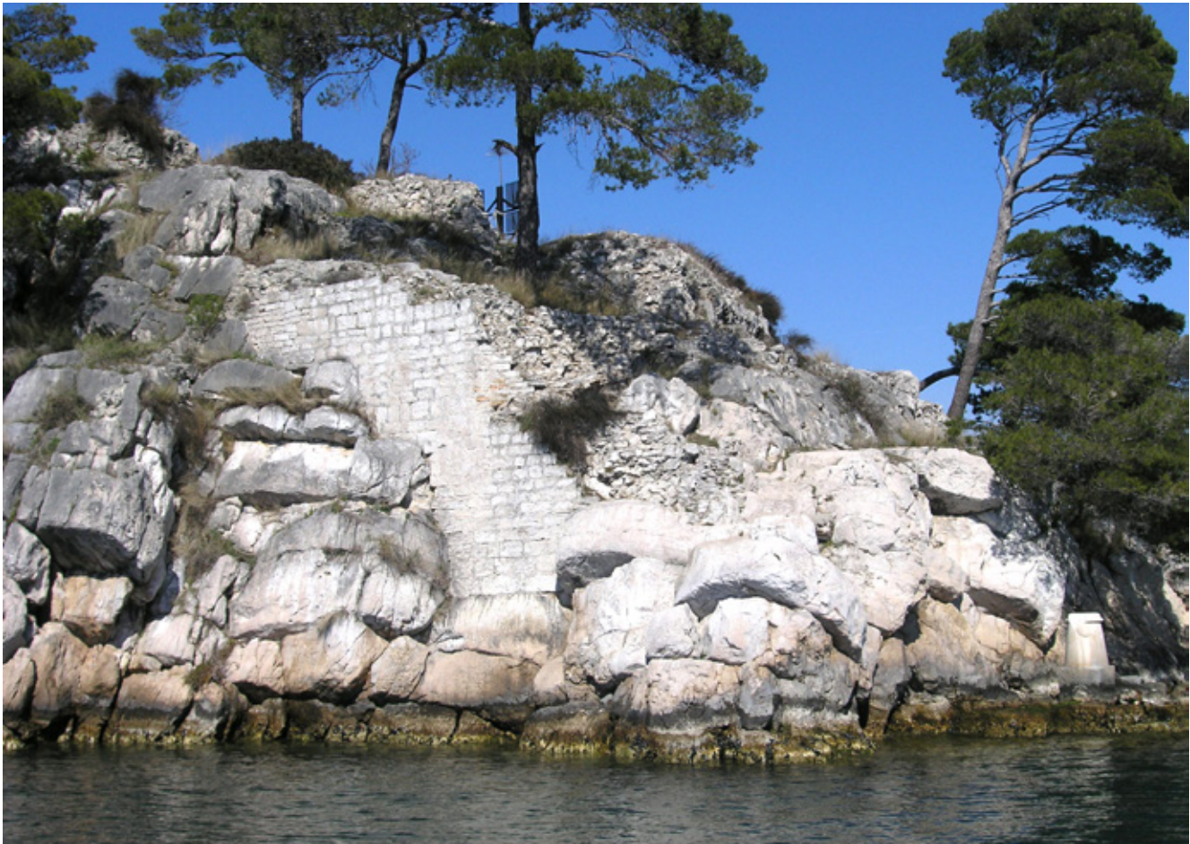
10. Pogled na ostatke bedema Velike kule

View to the bulwark remnants at the Large Tower