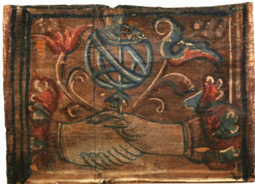
10. Stropna pločica s armilarnom sferom Ceiling panel with an armillary sphere