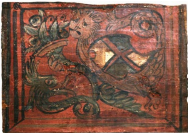
14. Stropna pločica s grbom Petrisa na turnirskom štitu i krilatim lavom

Ceiling panel with the coat-of-arms of the Petris family on a tournament shield with a winged lion