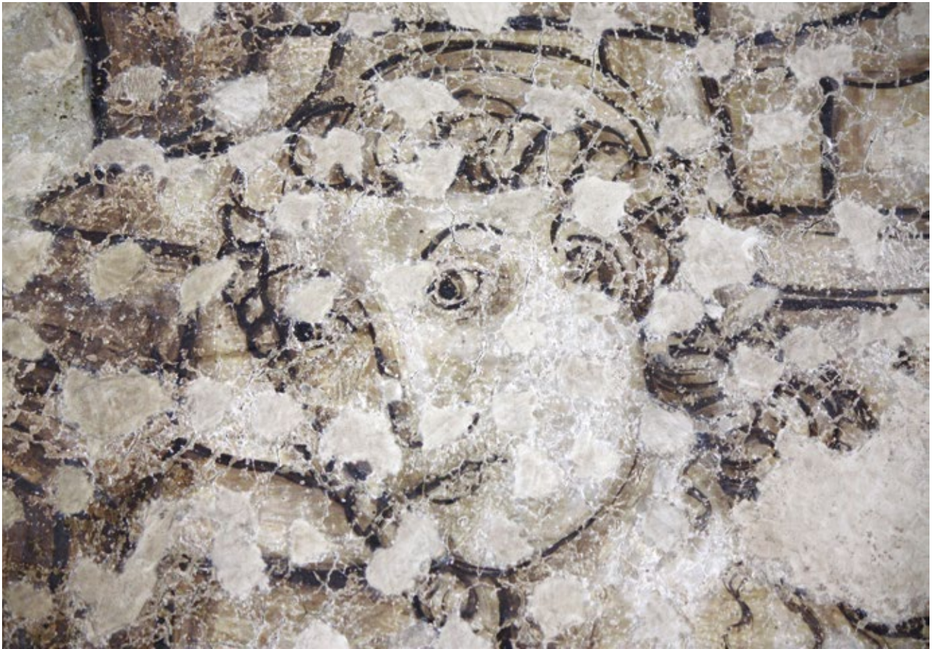
21. Zidni oslik na trećem katu palače, detalj

Wall paintings on the third floor of the palace, detail