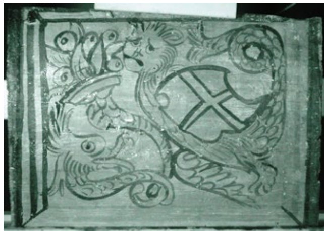
15. Stropna pločica s grbom Petrisa na turnirskom štitu i krilatim lavom, infracrveni snimak

Ceiling panel with the coat-of-arms of the Petris family on a tournament shield with a winged lion