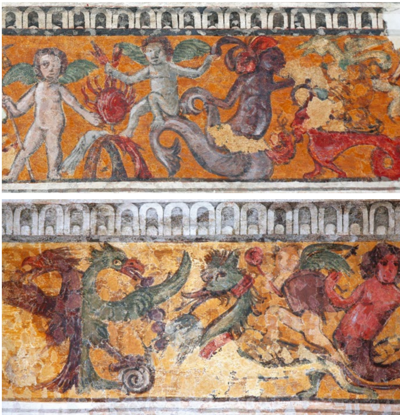
19. Oslikana bordura ispod stropa salona na prvom katu palače, detalji

Painted bordure under the ceiling of the salon on the first floor of the palace, details