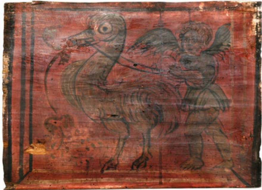
9. Stropna pločica s nojem i puttom (foto: D. Krizmanić) Ceiling panel with an ostrich and a putto

Na jednoj pločici crvene podloge je trofej s oružjem koji se sastoji od centralno postavljenog viteškog oklopa u kojega su umetnuta dva mača, dva tobolca sa strijelama, Hermesov štap (kaducej) te signum s lovorovim vijencem (sl. 8). Na jednoj pločici crvene podloge veliki je noj kojega na uzdama vodi putto . Iz nojeva kljuna izlazi biljna vitica (sl. 9). Noj, velika egzotična ptica čudnog izgleda i osobina, smatran je hibridom sam po sebi (pola ptica, pola zvijer), a u umjetnosti postaje posebno popularan nakon što ga je naslikao Raffael u Vatikanskoj palači 1519. godine. Nakon toga noj se često prikazuje kao dio različitih alegorija i groteski, a prisutan je i među simbolima alkemije zbog sposobnosti gutanja željeza pa označava kiselinu koja je korištena u pretvaranju zlata i srebra. 24