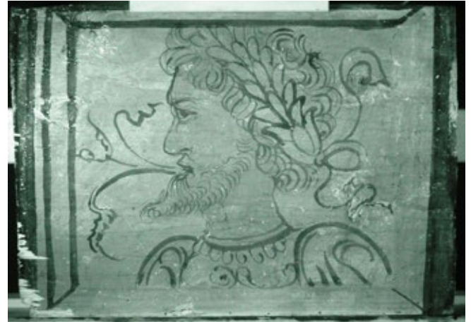
16. Stropna pločica s poprsjem muškarca