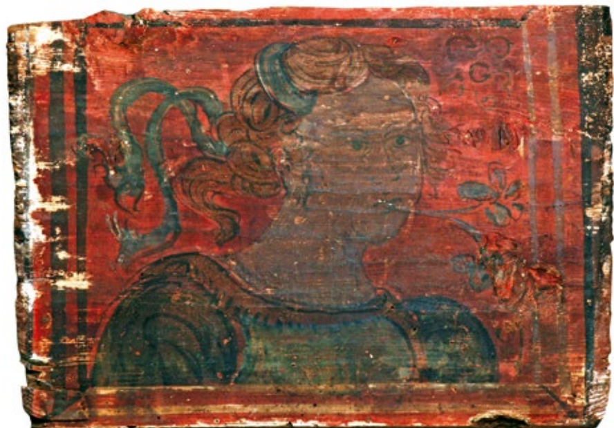
18. Stropna pločica s poprsjem žene

čicama smatrali su se karakteristikom francuske arhitekture te su nazivani „francuskim stropovima”. 25 Tek su u recentno doba elementi drvenih stropnih dekoracija sustavno analizirani, valorizirani, datirani i tematski grupirani. Sagledani su kao širi kulturni fenomen karakterističan za plemićku rezidencijalnu arhitekturu od 14. pa do sredine 16. stoljeća te kao odraz sazrijevanja ideja humanizma, sagledavanja civilnih vrijednosti, ali i dugog opstanka gotičke bajkovite narativne tradicije uz interes za životinjski svijet. Istodobno pripadaju gotičkoj modi ukrašavanja interijera plemićkih rezidencija oslikavanjem svih materijala i površina u kući i to živim bojama. Slikani motivi uglavnom su preuzeti iz profane literature; viteških romana, profanih ilustriranih rukopisa koji iz južne Francuske dolaze u sjevernu Italiju. Scene su većinom profane, ponekad poredane bez narativnog slijeda, a česte su teme bitke sa zmajevima, viteške i ljubavne scene, dvorske scene te životinje i čudovišta, kao i portreti i plemićki grbovi kojima se veliča naručitelj ciklusa te se u slikanom obliku prezentiraju obiteljske vrijednosti i postignuća. Životinje su vrlo čest motiv na oslikanim pločicama i zidnim oslicima iz tog razdoblja. Ukazuju na onodobno dobro