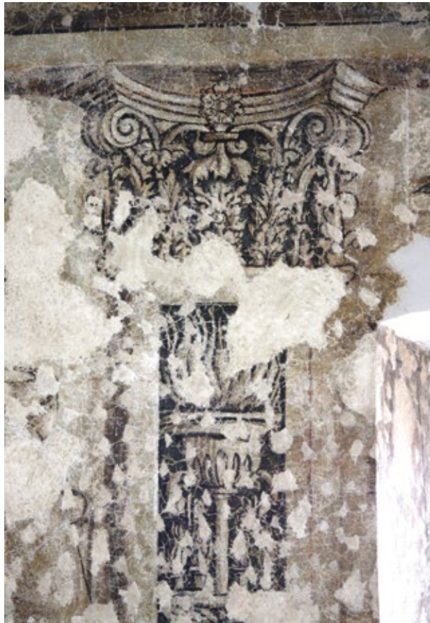
20. Zidni oslik na trećem katu palače, detalj

Wall paintings on the third floor of the palace, detail