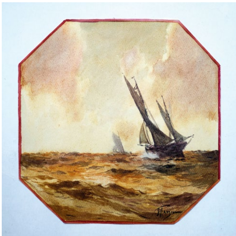
1. Aleksej Hanzen, More s dva jedrenjaka , oko 1915. g., privatno vlasništvo, Dubrovnik

Alexei Hanzen, Sea with Two Sailing Ships , around 1915