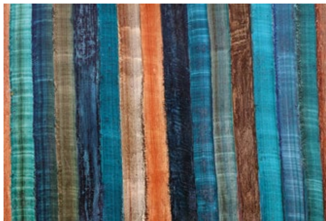
7. „Niz”, ulje, platno, 1972.