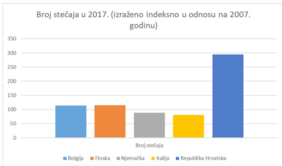
Grafikon 3. Broj stečaja poduzeća u 2017. godini (izraženo indekсно u odnosu na 2007. godinu)