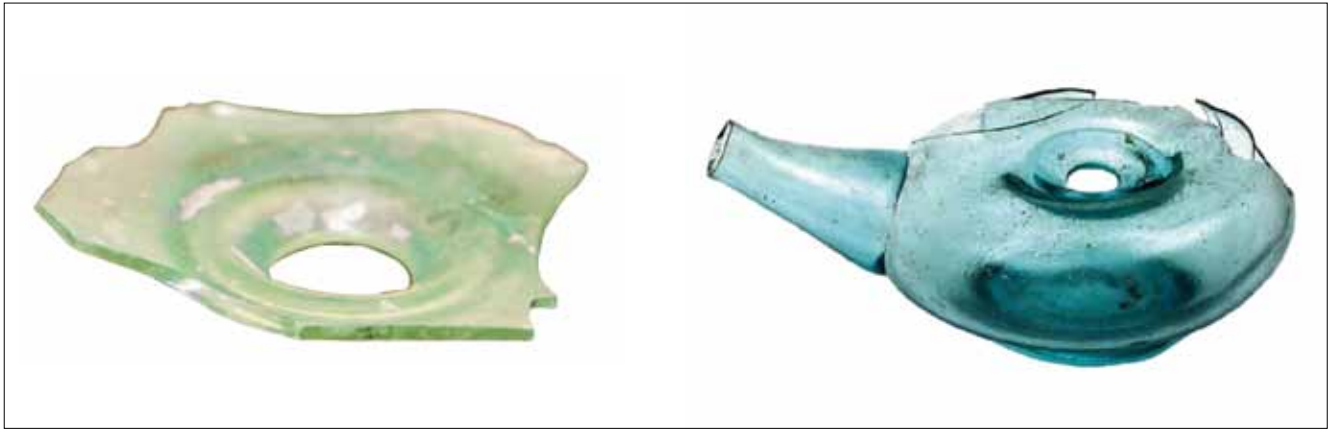
SLIKA 3. 1–2. 1: Osijek, Radičevićeva 3, ulomak diska; 2: Svjetiljka iz Splita (Buljević 2006, 109, sl. 1).