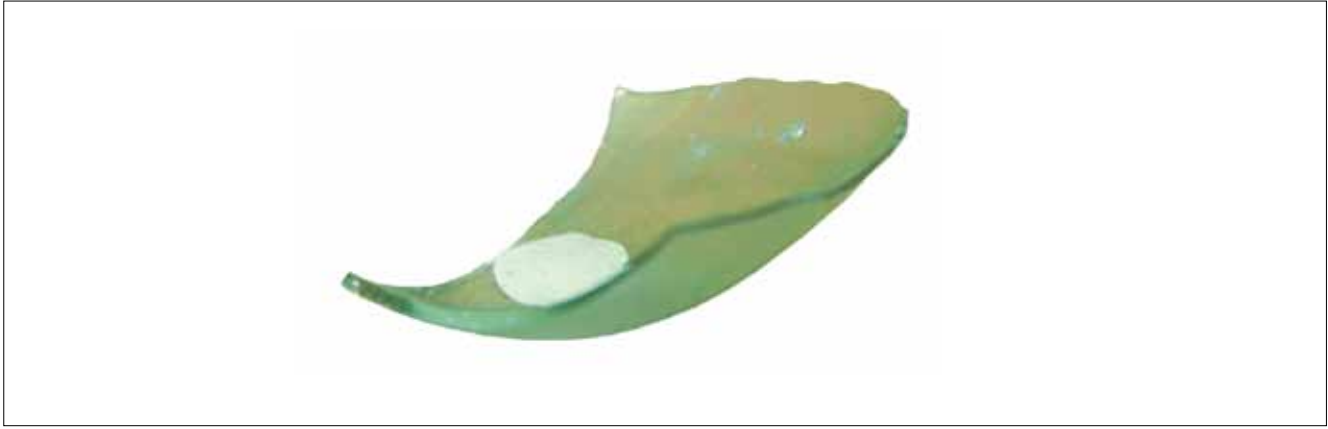
SLIKA 2. Osijek, Radičevićeva 3, ulomak dna posude ili svjetiljke (MSO 207083).