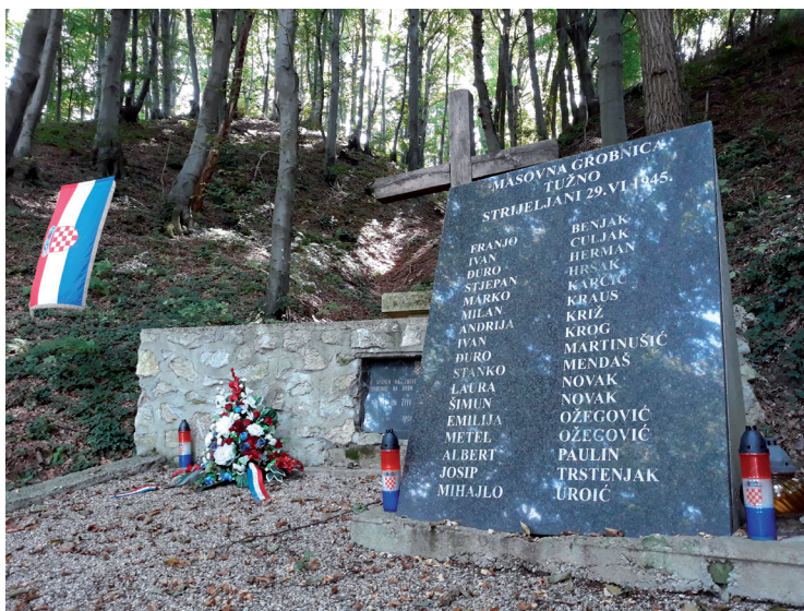
Slika 10. Masovna grobnica Drvarićeva šuma, Tužno 89.