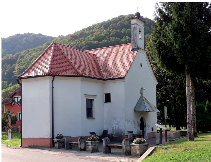
Slika 5. Kapelica Majke Božje u Beli u kojoj su sahranjeni članovi obitelji Ožegović.