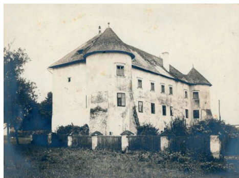
Slika 9. Dvorac Bela II, 1930-ih, fotografija, (Gradski muzej Varaždin, Kulturnopovijesni odjel, Zbirka fotografija i razglednica, inv. br. 87256).