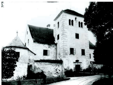
Slika 8. Pogled na dvorac Bela I, 1920-ih, presnimak (Gradski muzej Varaždin, Kulturnopovijesni odjel, Zbirka fotografija i razglednica, inv. br. 87265).

austrijskih zemalja. 76 Vlastelina su cijenili njegovi radnici i lokalni seljaci, koje je često savjetovao oko gospodarskih i imovinskih pitanja, te su se usprotivili kad mu je 1926. godine agrarnom reformom zemljište trebalo biti oduzeto i dano u zakup. 77