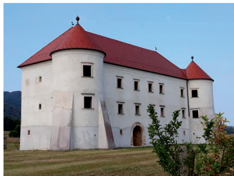
Slika 2. Dvorac Bela II.

Drugi je objekt na istome posjedu izgrađen u blizini Bele I, ali na nižoj nadmorskoj visini, i nazvan Bela II (Donja Bela). Prema Konzervatorskoj studiji iz 2004. godine Žmegač datira Belu II u sredinu 17. stoljeća 8 kada je posjed još uvijek bio u vlasništvu obitelji Petheö de Gerse. 9 Bela II rezidencijalna je građevina, jednokrilni dvorac s dvije kule. Pročelje je na sjevernoj strani dvorca, okrenuto prema rijeci Bednji, a začelje na južnoj strani gleda prema Ivanščici. 10 Bela II građena je u stilu baroka te je prepoznatljiva po arkadnim trijemovima na začelju i ugaonim kulama na pročelju koje imaju dekorativnu funkciju. 11 Oba dvorca te kultivirani krajolik na njihovom području ulazi u zaštićena kulturna dobra Republike Hrvatske. 12 Budući da se nalaze podno utvrde koja je prva nosila naziv Bela, za oba se dvorca u narodu ustalio naziv Podbela koji se može čuti i danas. Njihovi su se vlasnici nazivali belskim i/ili podbelskim vlastelinima.