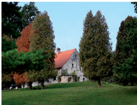
Slika 1. Dvorac Bela I s perivojem.