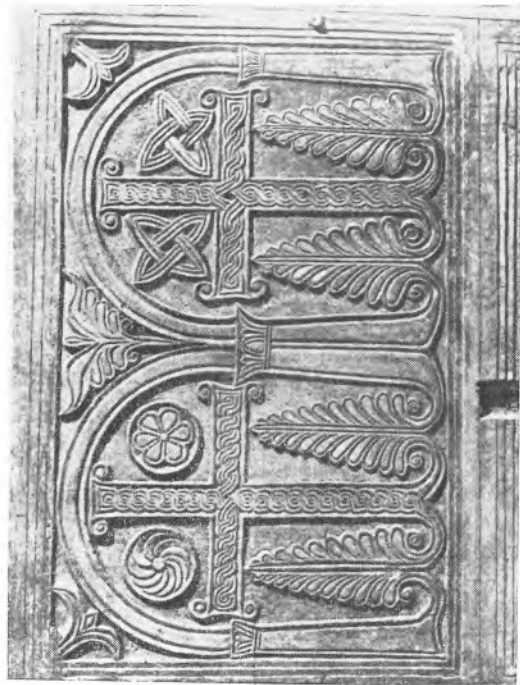
Sl. 2 Ornamentalno skulptirana ploča iz crkve S. Sabina u Rimu (prva polovica IX stoljeća)