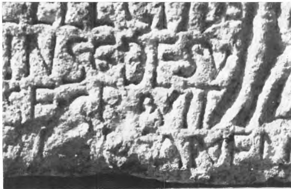
Sl. 5 Detalj donjeg desnog kuta natpisa sa oštećenom kontrakcijom TPE (tempore) ispred »Amen«.