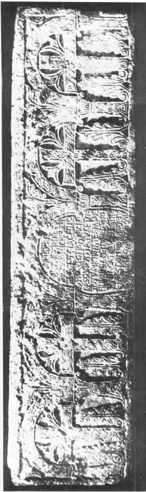
Sl. 1 Ranosrednjovjekovni sarkofag splitskog nadbiskupa Ivana suvremenika kralja Tomislava (druga četvrtina X stoljeća)