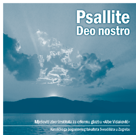
PSALLITE DEO NOSTRO Mješoviti zbor ICG A. Vidaković ICG A. Vidaković KBF-a