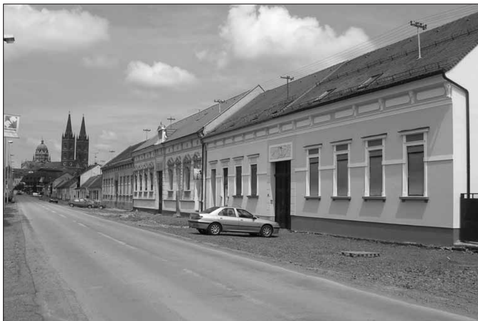
Tri koralističke kuće u Pavićevoj ulici.