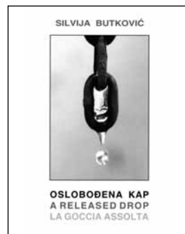
Silviya Butković, Oslobođena kap