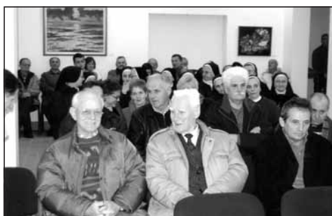
Promocija ZMĐ 8