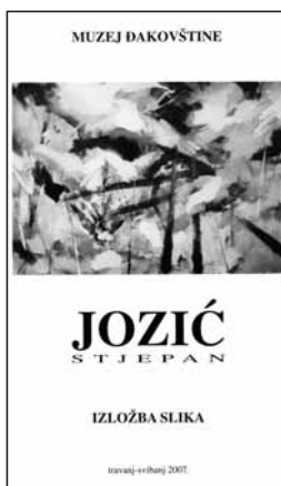
Ivo Belamarić, katalog Izložbe slika Stjepana Jozića