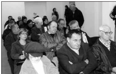
Promocija Scrinie Slavonice