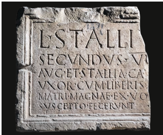
Slika 8 Ulomak ploče s natpisom Lucija Stalija Sekunda (OH)