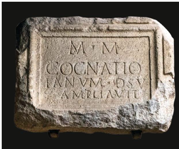
Slika 9 Ulomak ploče s kognacijskim natpisom (OH)

Kognacija je proširila svetište Velike Majke prema svom zavjetu.