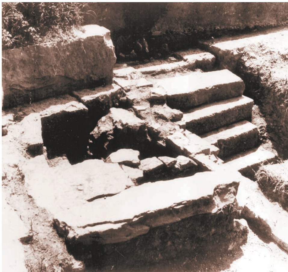
Slika 6 Hortus Metrodori, sonda XI. Stubište s pragom za silazak s ceste u prostore grobišnih parcela – pogled sa sjeveroistoka

istražena u unutrašnjosti veće od dviju ograđenih grobišnih parcela (»kula«), a sličnih je primjera bilo i u zapadnom dijelu istraženoga lokaliteta. Nad grobnicom je, po svemu sudeći, stajao monumentalni nadgrobni spomenik, možda sličan prethodno spominjanoj monumentalnoj nadgrobnoj ari Pomponije Vere, koja je naknadno bila uzidana u zapadne salonitanske bedeme. Iskopavanja u sondi VI nisu otkrila očekivane ostatke »kiklopskoga zida« u smjeru istoka, ali je iz Bulićeva plana iz 1910. godine, kao i kasnijega Abramićeva plana, moguće pretpostaviti njegov nastavak u smjeru zapadnih bedema: na tom je području Abramić, naime, nailazio na grobove, a to su pokazala i istraživanja u 1970. godini. U sondi VI istočno od veće od dviju »kula« je na dubini od 230 cm bila otkrivena cilindrična urna s poklopcem, a slična je nađena i u jugoistočnom uglu manje »kule«. Na urnama se vrlo dobro vide tragovi paljenja, ali u njima nažalost nisu bili otkriveni nikakvi grobni priloz.