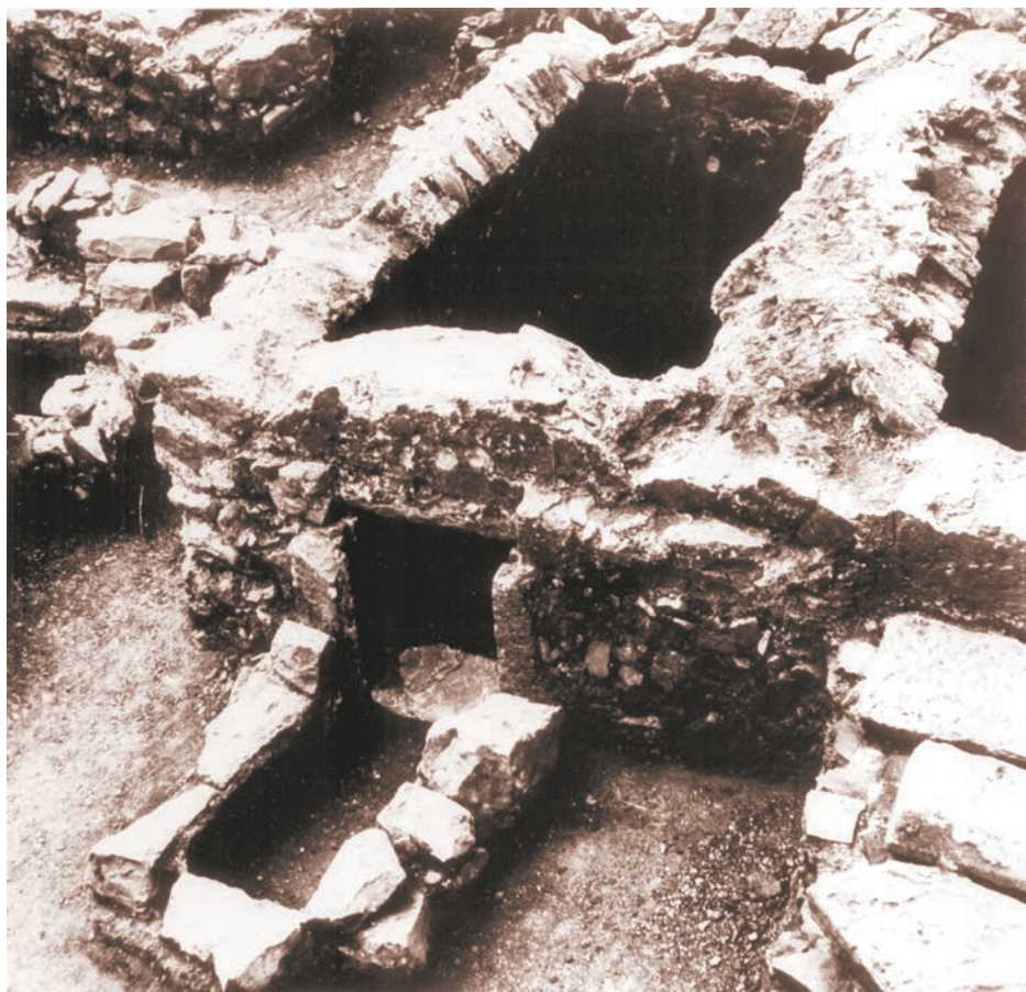
Slika 4 Hortus Metrodori. Novotkrivene grobne komore tipa a pozzo – pogled s istoka

različitoga sitnog metalnog inventara (brončane udice, čavli, ulomci žice itd.), kao niti nalazi brončanoga novca, najvećim dijelom iz kasnijih rimskih razdoblja. Budući da sondama istraženim u sjevernom dijelu lokaliteta nije bilo nalaza koji bi drugačije usmjerili pravac iskopavanja, radovi su bili nastavljani otvaranjem nekoliko novih sonda u južnom dijelu lokaliteta, bliže »kiklopskom zidu«. Rezultati koji su proizašli pokazali su se zanimljivima pa su neke manje sonde bile naknadno proširene, a mjestimice su među sondama bili uklonjeni i kontrolni profili (na situacijskom planu novootvorene sonde nose oznake Va, Vb, Vc i Vd te VIa i VIb). Od nalaza koji zaslužuju pozornost osobito je potrebno istaknuti nekoliko grobnih komora, koje ranije nisu bile evidentirane. Među njima su najbolje očuvane dvije međusobno spojene kasnoantičke grobne komore tipa a pozzo (sl. 4). Obje su u unutrašnjosti bile ožbukane, ali im je svod bio urušen, dok je