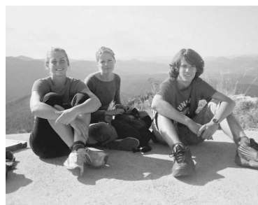
Mladi matematičari u pohodu na Klek