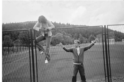
Popodnevno slobodno vrijeme