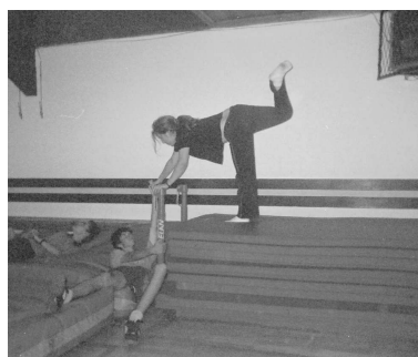
Teretana i dio dvorane