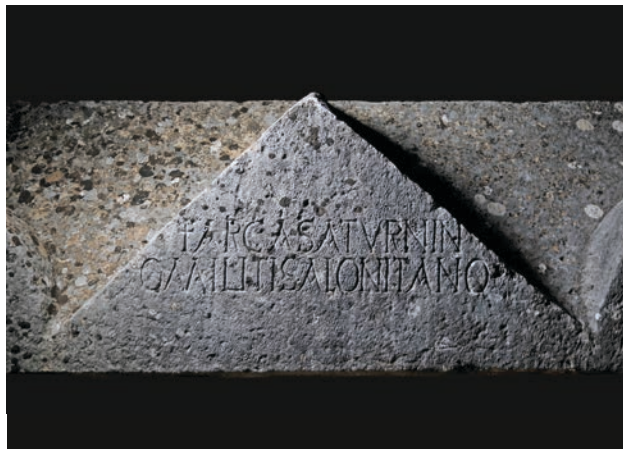
Slika 3 Natpis na sarkofagu Saturnina koji je bio miles Salonitanus

Natpis kojim je bio komemoriran ovaj vojnik i svojom kompozicijom odaje karakteristike slične sarkofagu Saturnina i Justine: uklesan je latinski križ, započinje riječju arca , ime i zanimanje su navedeni u dativu. Interesantna je slučajnost da se na oba natpisa spominje muško ime