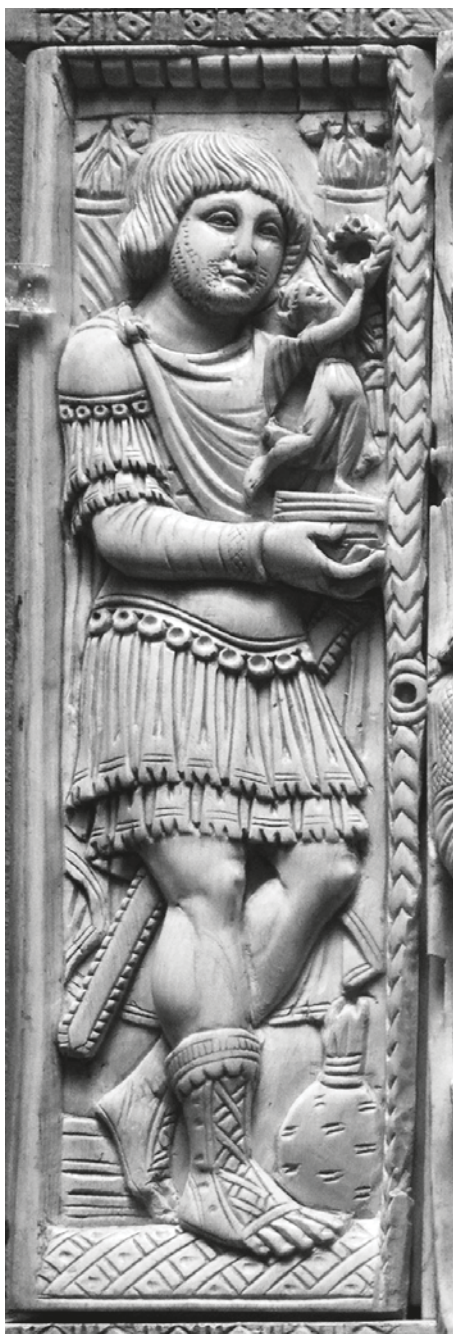
Slika 5 Detalj diptiha »Bjelokosti Barberini« s likom koji nosi ukrašene korice mača (D. Gaborit-Chopin 2003, str.50)