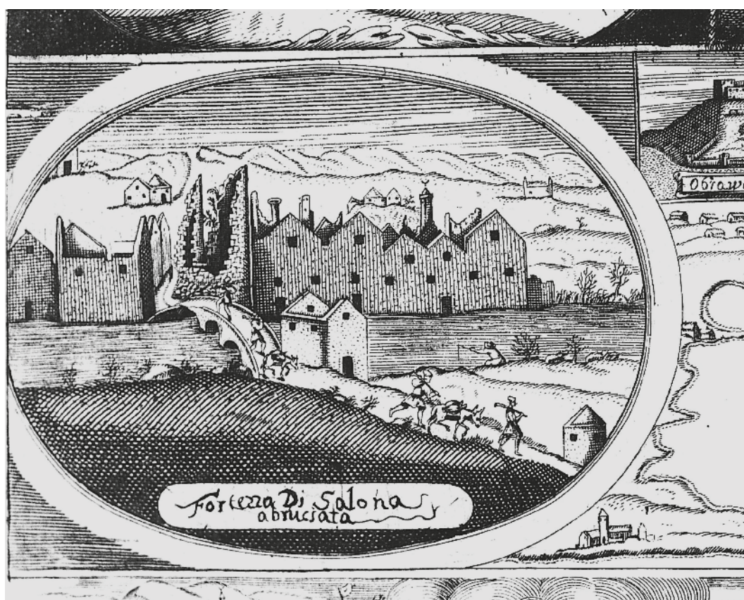
Slika 8 Solinski kaštel na grafici iz godine 1651., Museo Correr, Venecija