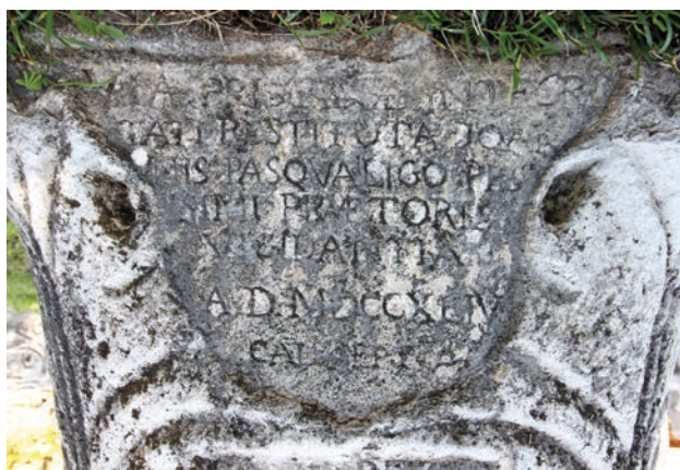
Slika 10 Natpis na kapitelu u Gradini o popravku ceste

mogućnosti za razvoj, toliko je on u jednoj mjeri i njihov »talac« jer su ostala povijesna razdoblja i zanimanje za njih gotovo ostala po strani. Međutim, i oni su vrijedni istraživanja. Ovaj rad prilog je poznavanju nestale i zaboravljene solinske povijesti.