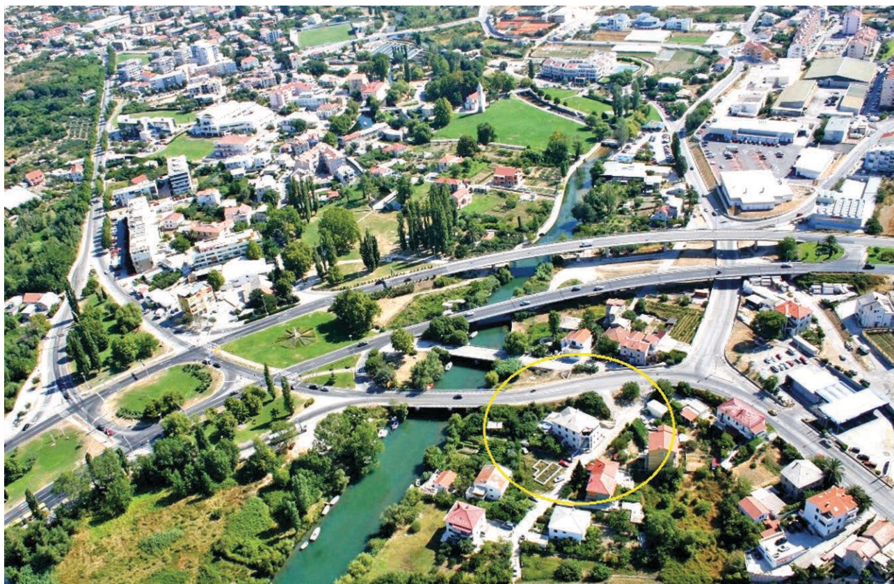
Slika 6 Približan položaj solinskoga kaštela danas

česta pojava. Kao takva donesena je na jednom od ranijih prikaza Klisa i okolice. 43 S obzirom na sve kasnije prikaze, a posebno one W. Dilicha iz 1609. godine 44 (sl. 7) i nepoznatoga autora iz 1647., radilo se o visokoj kvadratnoj trokatnoj kuli sa skarpom u donjem dijelu te kruništem i/ili mašikulom na konzolama na vrhu. Pojedini prikazi (npr. Rota, a posebno Camocio, koje kasniji kartografi kopiraju) kulu jednom donose s četverostrešnim krovom na vrhu, a drugi put bez krova. 45 S obzirom da se radi o vojnoj i obrambenoj građevini smatramo da krova nije bilo. Uz kulu je, kao što smo vidjeli, sagrađeno utvrđeno dvorište s kućama tako da je kula ostala na njegovoj istočnoj strani ili na jednom od uglova bedema – jugoistočnom ili sjeveroistočnom. Dvorište (u izvorima revelin, citadela i sl.) zauzimalo je nekih petstotinjak četvornih metara i