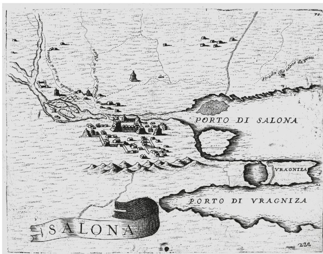
Slika 5 V. M. Coronelli, Solin oko godine 1694.

vojnike koji se stajao sa zapadne strane ceste na prilazu mostu iz pravca Splita. 38 Kvartir je služio kao smještaj vojnicima koji bi do Splita pratili turske trgovačke karavane, a već je 1804. gotovo u potpunosti srušen. Preko puta kvartira, istočno od ceste na prilazu mostu iz pravca Splita, stajala je do Drugoga svjetskog rata mletačka carinarnica. Frane Bulić i Lovre Katić spominju toponim Kvartir za cijeli ovaj predio s kućama (obitelji Bulić) koje su velikim dijelom porušene tijekom njemačkoga bombardiranja u Drugome svjetskom ratu. 39 I kvartir za vojnike kao i carinarnica bile su kuće manjih dimenzija (kvartir oko 10 x 8 metara). S druge strane mletački kaštel je bio znatno veći. Solitro donosi podatak (pismo splitskoga kneza vjerojatno iz godine 1574.)