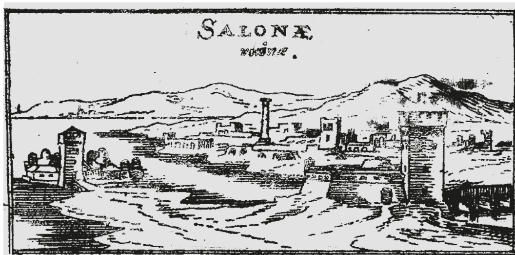
Slika 7 Solinski kaštel u knjizi W. Dilicha iz godine 1609.