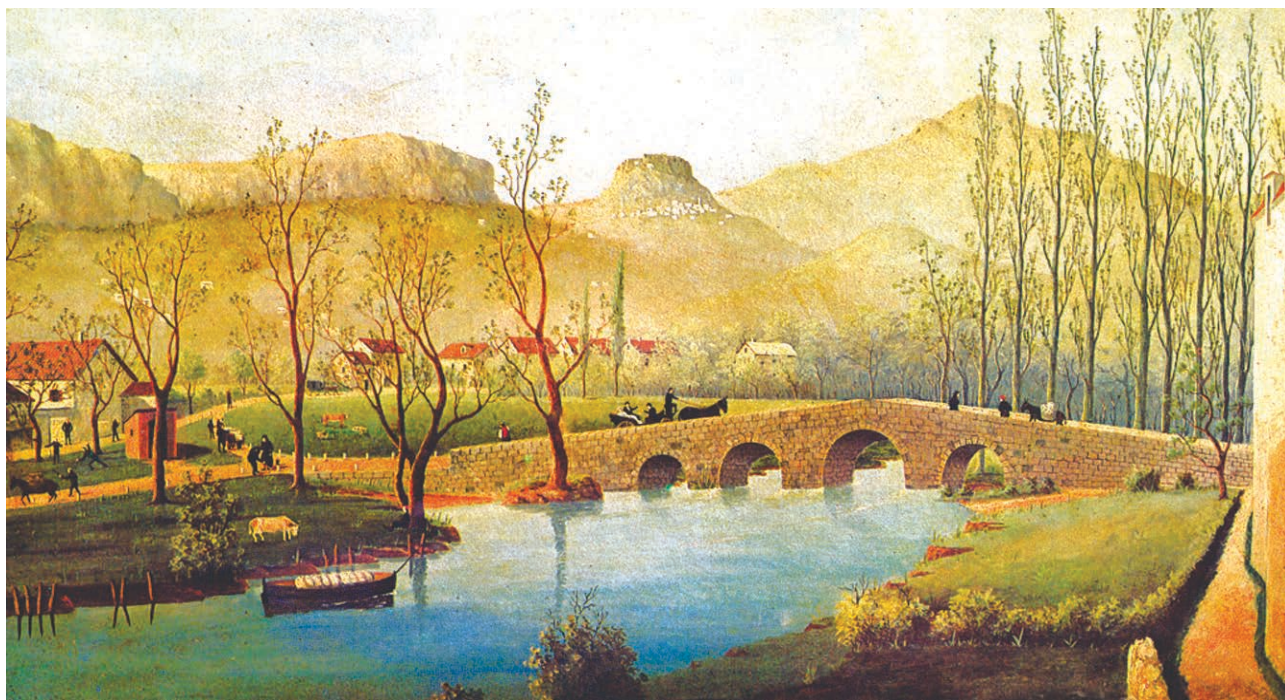
Slika 2 M. Olivero, Most u Solinu 1892. , Muzej grada Splita

nezainteresiranosti stratiota za boravkom u Solinu, toliko i u turskim ometanjima toga posla. Ipak, s gradnjom se započelo vjerojatno 1531. ili početkom 1532. Izravan povod za konačni početak gradnje revelina je zasigurno gradnja turske utvrde u Gradini koja je završena u srpnju 1531. i nakon toga se dodatno utvrđivala i naoružavala. 11 U ožujku te godine u Solinu su se našli splitski knez Leonardo Bollani i generalni providur za Dalmaciju Georgio Pizzamano, i to na početku gradnje revelina koju su nekoliko puta pokušali prekinuti Turci iz utvrde u Gradini. 12 Isti splitski knez po povratku sa svoje dužnosti, u srpnju 1534., izvješćuje mletačku Signoriju kako je oko ove utvrde hitno potrebno dovršiti započeti revelin za smještaj stratiota. Trideset stratiota je stalno potrebno za nadzor Splitskoga polja, a njih 10 uvijek mora biti u solinskom kaštelu. Majstori i vještaci ( prothi et periti ) radove su procijenili na 300 dukata (bez drvene građe). 13 Iz vijesti koje