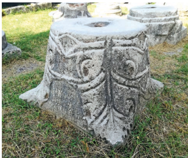
Slika 9 Kapitel s natpisom iz godine 1744. u Gradini

Solinsko antičko i ranosrednjovjekovno nasljeđe ima nemjerljivu ulogu u kontekstu nacionalne, ali i europske povijesti. Koliko god ono gradu Solinu pružalo