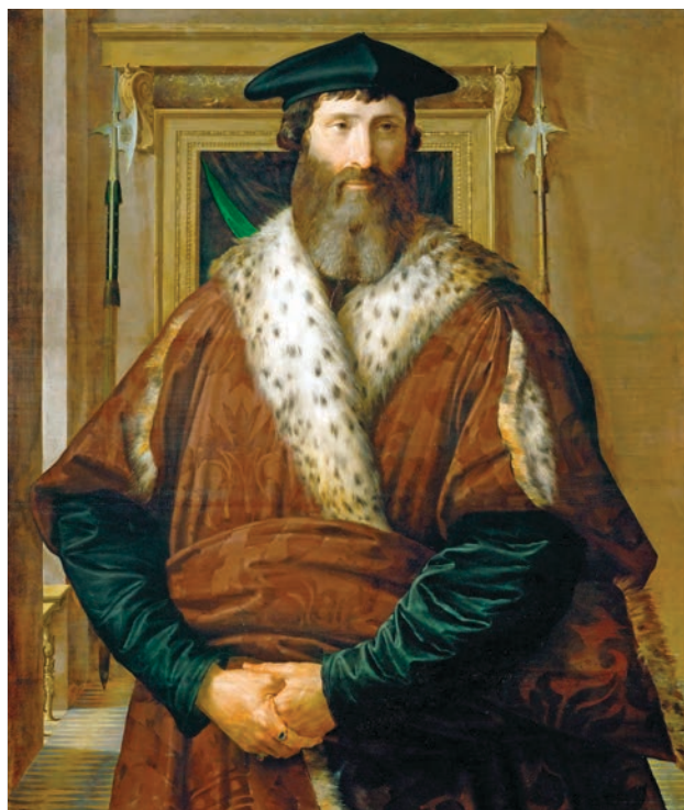
Slika 3 Parmigianino, Malatesta IV. Baglioni, Kunsthistorisches museum, Beč

mletački teritorij, previše vremena prođe dok se stratioti (i ostali) organiziraju u Splitu i krenu ususret Turcima. Dru-goga mosta na rijeci nema pa Turci i ostali koriste gazove i plićake za prijelaz. 20