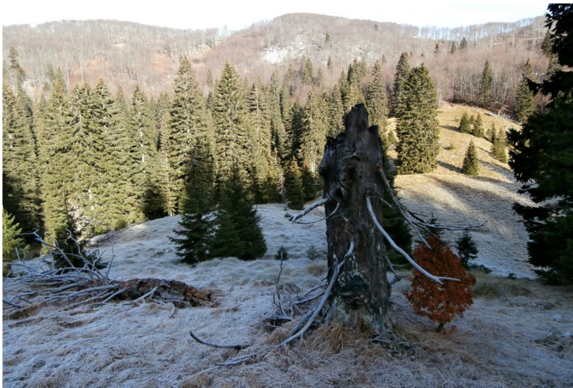
||| Pretplaninska šuma smreke u predjelu Ceclje ukazuje na mrazišne uvjete | Foto: Marko Randić