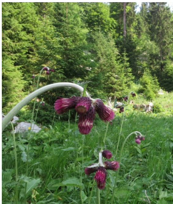
||| Osjak ( Cirsium wadsteinii x C. erisithales )

Dobro očuvana šumska prostranstva Šverde, Ceclja, Bačve, Dugarišća, Lisine, Bukove gore, Smrekovca i drugih okolnih predjela odlikuju se divljinom prirode i razmjerno teškom prohodnošću zbog brojnih razvedenih grebena, ponikava, udolina i šumskih stijena, pa nije čudo da su ga, kao slabo istraženo, za „svoje“ područje izabrali speleolozi koji ovdje na svakom pohodu pronalaze nove, dotad neistražene speleološke objekte. Zbog sličnih je razloga šire područje Šverde i botanički ostalo slabije poznato nego drugi pretplaninski dijelovi Gorskog kotara, kao što su primjerice planine Risnjak i Snježnik, danas zaštićene unutar granica nacionalnog parka. Potvrda ove tvrdnje o slabijoj botaničkoj istraženosti je da su upravo speleolozi na području Šverde pronašli dotad u Hrvatskoj neprobađenu i u botaničkim bazama podataka neregistriranu svojtu osjaka. Radi se o zanimljivom križancu Cirsium wadsteinii x C. erisithales koji se odlikuje purpurno-ljubičastim cvatom. Zbog brojnih prirodnih vrijednosti čitavo je područje uključeno u ekološku mrežu Natura 2000 u sklopu šireg područja Gorskog kotara.