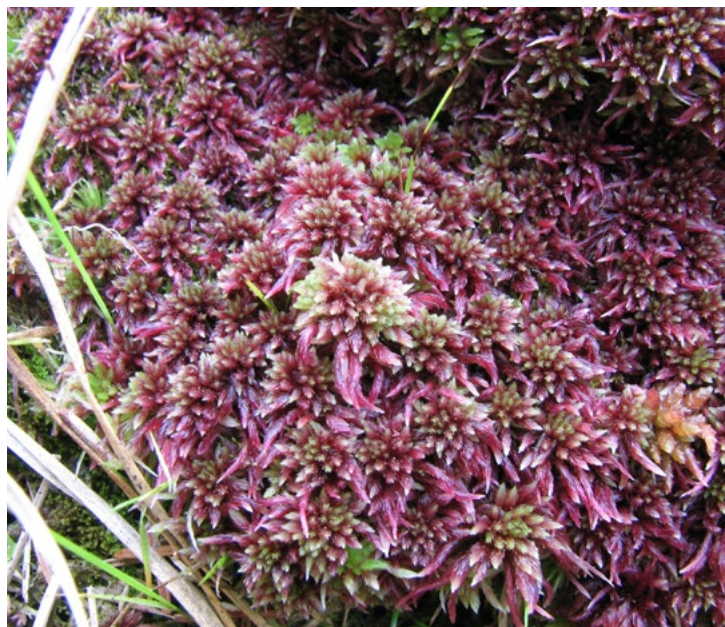
||| Mah tresetar ( Sphagnum sp.) karakteristična je vrsta nadignutog dijela creta na Trsteniku

Hrvatskoj. Na njemu svoje posljednje utočište u Hrvatskoj našle su rijetke cretne biljke poput rukavičaste suhoperke ( Eriophorum vaginatum ) i buhinog šaša ( Carex pulicaris ) (Topić i Ilijanić, 2002; Ilijanić i Topić, 2002). Uokolo nadignutog dijela creta razvijaju se fragmenti bazofilnog creta koji ima sasvim drugačiji florni sastav i ekologiju (Topić, 2010).