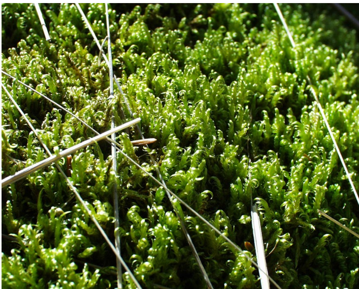
||| „Kukičasta mahovina“ ( Sanionia uncinata ) pokazatelj je mrazišta u ponikvama