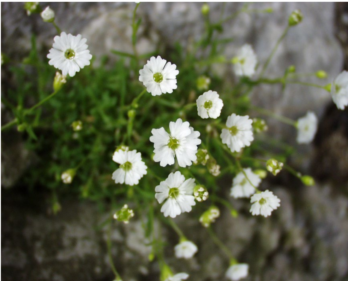
||| Majušna pušinica ( Silene pusilla ) indikator je vegetacije snježišta Dinarskih planina

koja se redovito na najhladnijim mjestima udružuje s jednom vrstom mahovine - Sanionia uncinata (Modrić Surina i Surina, 2001). Iznad dna ponikve Ceclje, ali i drugih dubokih ponikava šireg područja Šverde razvijena je i posebna šumska vegetacija, u prvom redu pretplaninska šuma smreke (ovakve šume također su značajka izrazitih mrazišta), a pri dnu, ali iznad mjesta s biljkama snježišta susreću se grmolike sastojine klevine planinskog bora i/ili velelisne vrbe. Uokolo ponikava uobičajeno uspijeva pretplaninska šuma bukve raširena na čitavom području Gorskog kotara iznad 1200 m nadmorske visine.