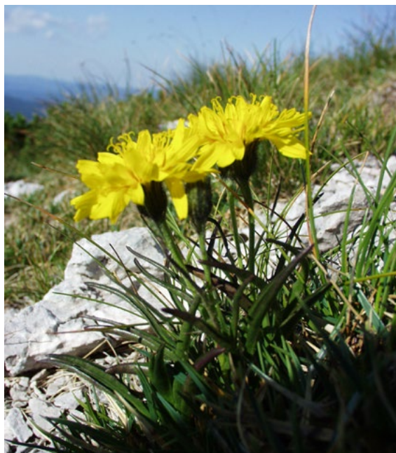
||| Kernerov dimak ( Crepis jacquinii subsp. kernerii ) osim na najvišim vrhovima Gorskog kotara raste i u dubokoj ponikvi Ceclje

Na užem području detaljnije je botanički istražena duboka ponikva Ceclje koju je kao „najljepši primjer vegetacije mrazišta“ proučavao poznati hrvatski botaničar prof. dr. Ivo Horvat. „Botanički fenomen ponikava“ prema Horvatu osobito je dobro izražen u dubokim pretplaninskim ponikvama poput Ceclja, gdje su zapaženi specifični uvjeti mikroklimi uz posljedične posebnosti u rasporedu svojti i zajednica biljnog svijeta (Horvat, 1962). U takvim ponikvama dugo u proljeće leži neotopljeni snijeg ohlađujući okolni zrak. Idući od ruba ka dnu ponikve primjećujemo da je biljni svijet prilagođen sve oštrijim uvjetima mikroklimi. Iz pukotina u kamenitom dnu pretplaninskih ponikava, čak i kad nema snijega, često se osjeća strujanje ledenog zraka čija temperatura i ljeti ne prelazi nekoliko stupnjeva Celzijevih. Činjenica je, koju su isticali istraživači krških predjela i prije Horvata, da se u pretplaninskim ponikvama i u krškim uvalama sjeverozapadnih Dinarida temperatura može spustiti ispod ništice u bilo koje doba godine – i zimi i ljeti. Zbog toga se, kad se primjerice spuštamo u ponikvu, možemo osvjedočiti o pojavi temperaturne inverzije i inverziji vegetacije. Prema dnu ponikve, gdje biva sve hladnije i hladnije,