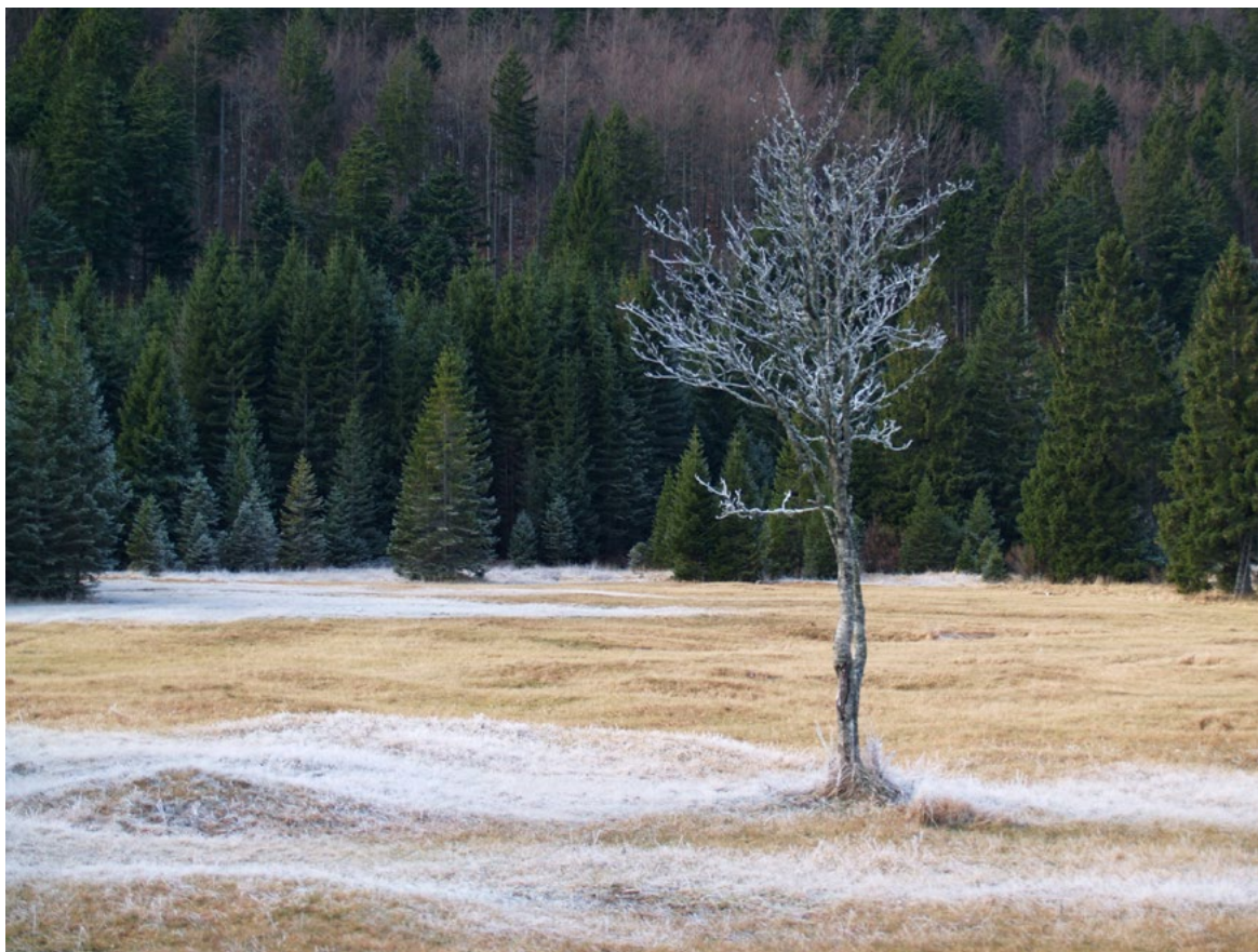
||| Mraz na Trsteniku