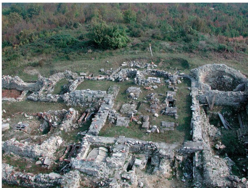
Slika 7. Rudina – pogled sa zapada na kompleks romaničke crkve sv. Mihovila