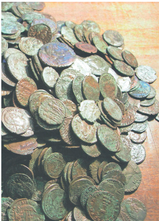
Slika 2. Dio skupnog nalaza novca iz Treštanovaca (prema Davor Margetić 2012)