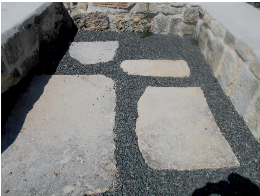
Slika 11. Pogled na dio tornja romaničke crkve sv. Mihovila (lipanj 2017.)