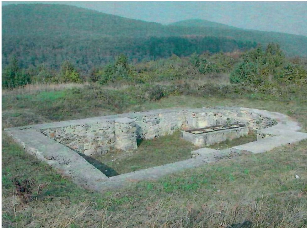
Slika 3. Pogled na unutrašnjost ranoromaničke crkve iz 10. – 11. stoljeća na Rudini

kladno njegovoj namjeri. Ujedno treba omogućiti uspješnu obnovu i prezentaciju spomenika.