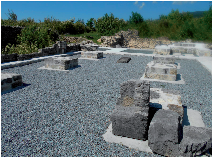
Slika 10. Pogled na lađu romaničke crkve sv. Mihovila (lipanj 2017.)