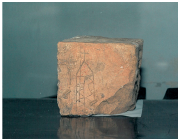
Slika 12. Zaglavni kamen rotonde u Dolcu

Zahvaljujući mag. šumarstva Jurju Zeliću, dugogodišnjem suradniku Muzeja grada Požege, 1997. godine. obavljena su probna i zaštitna arheološka istraživanja na nalazištu Kuzma iznad Dolca. Otkriveni su temelji romaničke crkve – rotonde iz 12. stoljeća, građene kamenim blokovima, dim. 10,79 x 8,50 m i debljine zidova 1,30 m. Prigodom istraživanja pronađen je zaglavni kamen s urezanim prikazom crkve, kamen s natpisom, raznobojne freske, ulomci keramike i ostatci pokojnika ispod poda crkve. Ta rotunda u Dolcu feudalna je kapela koja je pripadala burgu Dolac. Oblik crkve poznat je u srednjoj Europi još od karolinškog doba i proširen je u doba romanike u Mađarskoj. Takve crkve nalaze se na prostoru Zagrebačke biskupije. Predlaže se obnova te crkve, jer se nalazi nedaleko od burga Dolac, kojem i pripada. Blizu je sela Dolca i Požege, pa može biti kulturno-turističko odredište.