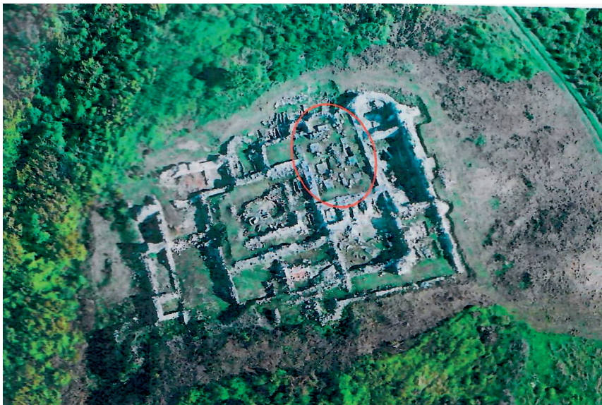
Slika 6. Rudina – vertikalna snimka kompleksa benediktinske opatije sv. Mihovila iz 12. stoljeća