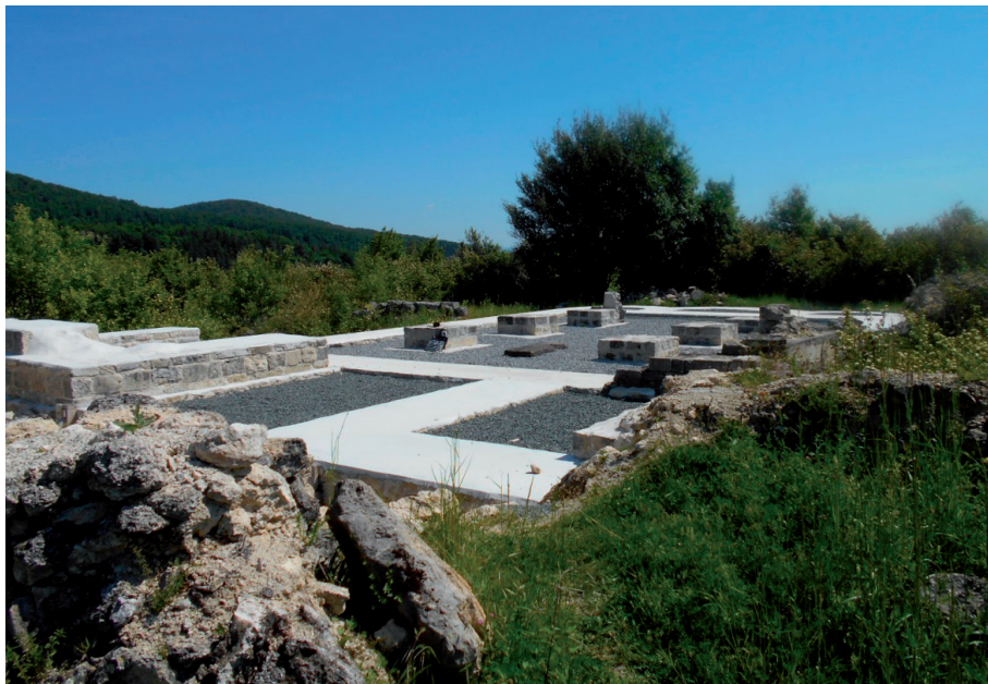
Slika 8. Pogled na novokonzerviranu romaničku crkvu sv. Mihovila (lipanj 2017. – HRZ)