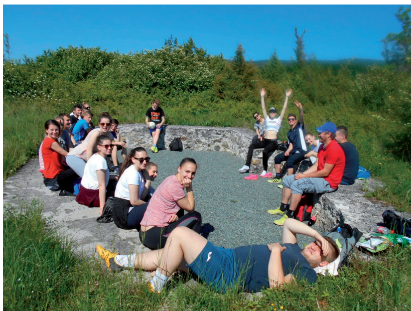
Slika 5. Novokonzervirana romanička crkva s kraja 10. i početka 11. stoljeća