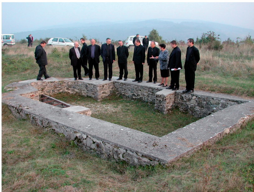
Slika 4. Posjet sudionika Biskupske konferencije u Požegi Rudini 2001. godine