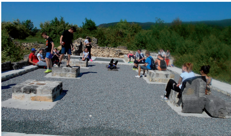
Slika 9. Pogled s istoka na lađu romaničke crkve sv. Mihovila iz 12. stoljeća (lipanj 2017.)