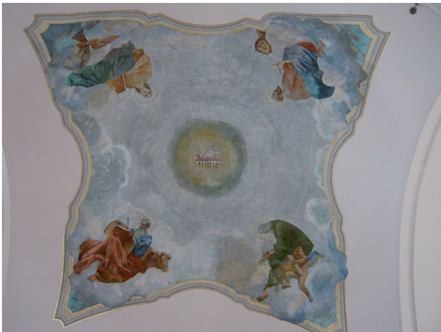
Slika 29. Sv. Ivan, sv. Matej, sv. Luka i sv. Marko, evanđelisti, scena na svodu glavne lađe katedrale sv. Terezije Avilske

Prizor Presvetoga Trojstva s likovima Boga Oca, Sina i Duha Svetoga naslikali su zajednički slikari Oton Iveković i Celestin Medović. (sl. 29)