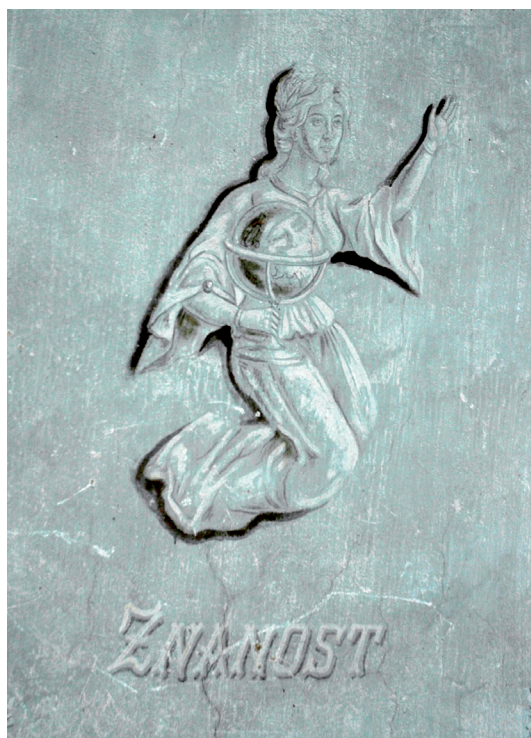
Slika 5. Zidna slika u kući dr. Franje Arha u Požegi

U vrijeme baroka poznata su imena dvaju slikara zidnoga slikarstva. Riječ je o isusovcu Josipu Kraljiću, slikaru koji je slikao u crkvi sv. Lovre, i stranom slikaru Franciscusu Weittenhilleru, koji je slikao u crkvi sv. Mihovila u Stražemanu (sl. 6), crkvi sv. Terezije i crkvi Duha Svetoga u Požegi, a čije je ime s naznakom godine navedeno na samoj slici.