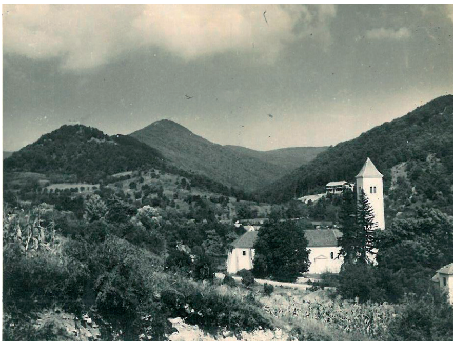
Slika 7. Crkva sv. Augustina u Velikoj u sklopu srednjovjekovne kapele sv. Marije

Crkva je još u srednjem vijeku nastojala ne samo duhovno nego i materijalno, kao građevinu, čuvati crkvu. Tim nastojanjima pridonijela je i sama freska s prikazom sv. Kristofora, koji je imao štititi iz daleka hodočasnike koji su tim povodom dolazili u kapelu Majke Božje (Matić, 2014: 13-33).