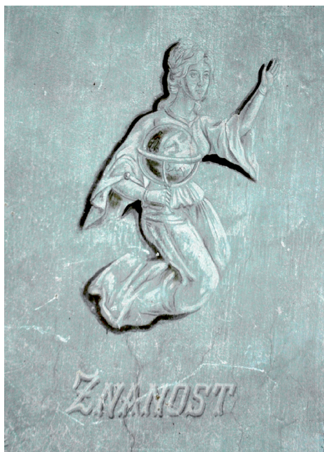
Slika 33. Znanost, alegorijska slika u stubištu kuće dr. Franje Arha u Požezi

Desno od toga kolnog prolaza jest ulaz koji vodi na stubište s odmorištem.