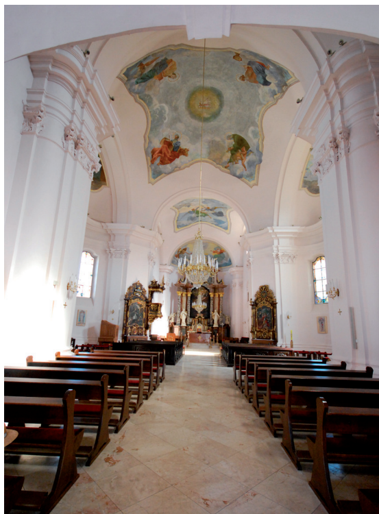
Slika 28. Oslikani svod svetišta i glavne lađe u katedrali sv. Terezije Avilske

Unutrašnjost crkve oslikala su dvojica poznatih hrvatskih slikara Celestin Medović (1857. – 1920.) 23 i Oton Iveković (1869. – 1939.) 24 , dok je dekorativni požeški slikar Pavao Fabac pod njihovim nadzorom slikao dekoraciju crkve. (sl. 28)