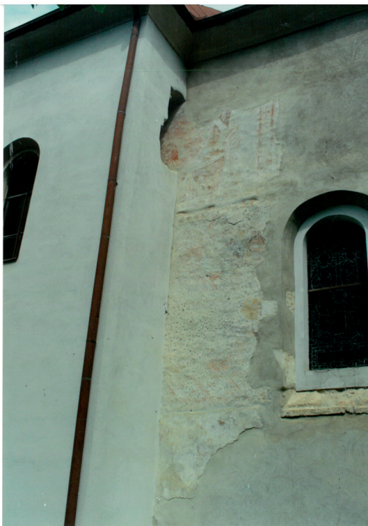
Slika 13. Sv. Kristofor, scena na južnom zidu crkve sv. Augustina (kapele sv. Marije) u Velikoj

U srednjem vijeku prikaz sv. Kristofora znao se slikati na ulazima u crkve jer se vjerovalo da onaj tko pogleda lik sveca taj dan neće umrijeti i da može putovati bilo kamo jer će ga Kristofor zaštititi. Kao zaštitnik putnika (hodočasnika) na vanjskoj strani crkve stare kapele sv. Marije očito je imao istu svrhu (sl. 13).