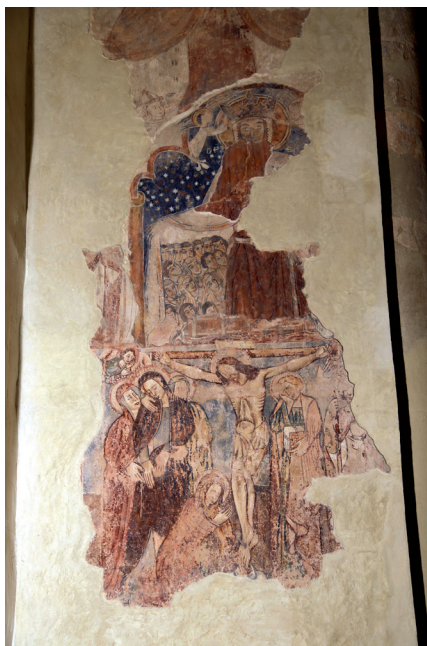
Slika 11. Raspeće, scena na zapadnoj strani trijumfalnog luka glavne lađe crkve sv. Lovre

Raspeće je do motiva svetica prikaz koji gotovo da ima svoju priču. S lijeve strane sv. Mariju, shrvanu od boli, pridržavaju dvije žene predstavljajući s njom jednu jedinstvenu ožalošćenu cjelinu. Desno od križa sv. Ivan sam u svojoj grčevitoj molitvi, dok je sv. Marija Magdalena do njega gotovo izdvojena u