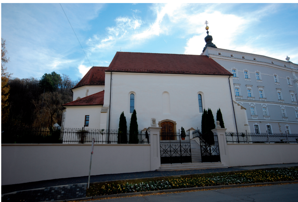
Slika 8. Crkva sv. Lovre u Požegi

U srednjem vijeku u samoj Požegi spominju se tri značajne crkve: župna crkva sv. Pavla 8 , dominikanska crkva sv. Marije (sv. Lovre) i franjevačka crkva sv. Dimitrija (Duha Svetoga). Od te tri crkve jedino današnja crkva sv. Lovre (sv. Marije) ima sačuvane freske iz razdoblja srednjega vijeka. Istraživanja su u više navrata donosila nove spoznaje. Istraživanjem poduzetim 1970. godine na dominikanskim izvorima u Rimu utvrđeno je da se crkva sv. Marije (sv. Lovre) nalazila uz dominikanski samostan u Požegi koji danas više ne postoji. Crkva s freskama u Rimu pripada vjerojatno sredini 13. stoljeća (Kradić: 1970).