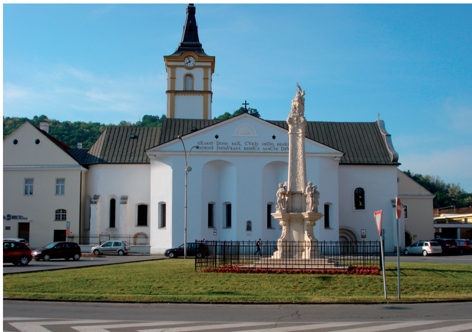
Slika 23. Franjevačka crkva Duha Svetoga u Požezi

Crkva Duha Svetoga u Požezi nakon požara 1842. godine postupno je obnavljana. Uređivanje crkve trajalo je cijelu drugu polovicu 19. stoljeća. Crkva je redovito ličena.