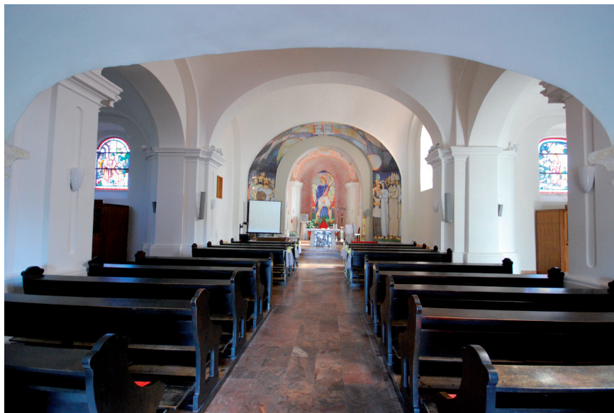
Slika 19. Freske u svetištu crkve sv. Mihovila u Stražemanu