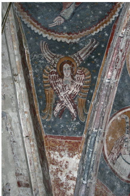
Slika 1. Anđel Serafin, scena u svetištu crkve sv. Lovre

Požeška kulturna baština posebno je značajna jer je živjela na sjecištu puteva i kultura od zapada prema istoku i od sjevera prema jugu. Okružena bogatim vodotocima, šumama, divljači, zaštićena planinama, bogata rudnim bogatstvom bila je svojevrsna oaza mira, ali i uvijek željeno mjesto oko kojeg su se vodili ratovi, gdje su se seobama izmjenjivale različite kulture. Gradilo se i rušilo. Danas sakupljamo tragove duhovnoga života posredovanjem onog materijalnog što je ostalo. Zidno slikarstvo stoga na specifičan način spaja društvene slojeve, umjetnike, svećenike, obrtnike, žene, muškarce, siromašne i bogate.