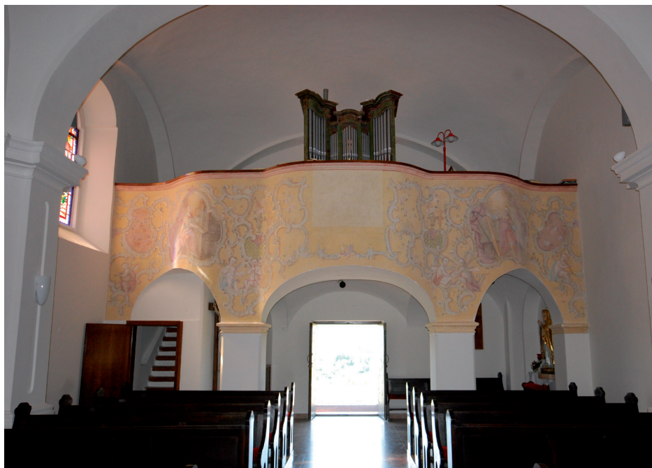
Slika 6. Zidna slika u crkvi sv. Mihovila u Stražemanu

Autori su zidnog slikarstva u crkvama do 19. stoljeća redovnici, a nakon toga svjetovni slikari.