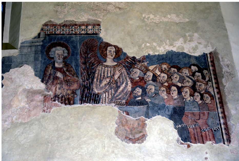
Slika 4. Freske na južnom zidu glavne lađe u crkvi sv. Lovre

Barokne crkve dobivale su bogatije zidne slike. Osim motiva, tu dominira ukrasni okvir slike uglavnom od štuka. Takve slike davale su ambijentu žive i bogate slikovne sadržaje. Biblijski prizori te životi svetaca prikazuju se živopisno, ovoga puta ne neukom, nepismenom vjerniku nego, nakon oslobođenja zemlje od Osmanlija, čovjeku željnom slobode i života, zahvalnom kršćaninu čija je vjera bila stoljeće i pol zatumljena i kroz slikarstvo.