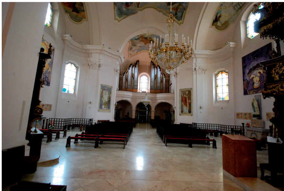
Slika 30. Zidne slike u glavnoj lađi i na pjevalištu crkve sv. Terezije Avilske

Četiri skice u vidu slika navedenih evanđelista sa signaturom autora Otona Ivekovića danas su izložene u Dijecezanskom muzeju Požeške biskupije. Riječ je o skicama koje su nastale nakon 1926. godine, kada je zvonik crkve pao u lađu i uništio slike evanđelista na svodu. Obnova slika ponuđena je slikaru Otonu Ivekoviću, koji je posao i prihvatio.