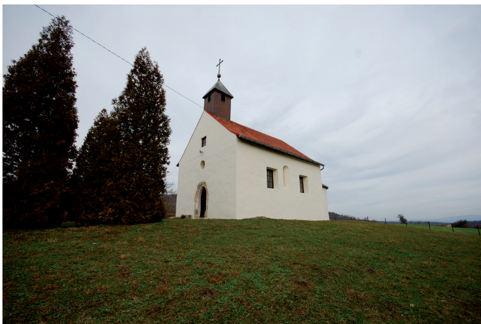
Slika 16. Crkva sv. Mihovila u Ratkovici

Do samog trijumfalnog luka na zidu je fragmentarno sačuvana sućutna scena Imago pietatis ili Vir dolorum , Krist u boli. (sl. 16)