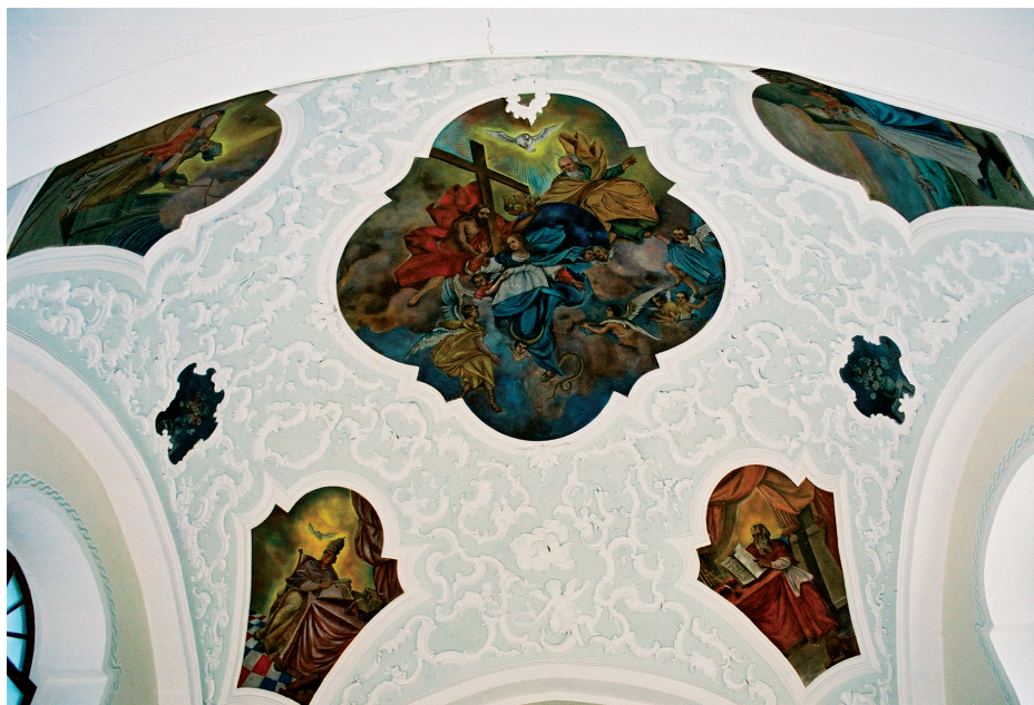
Slika 22. Freske na svodu svetišta crkve Svih Svetih u Sesvetama

Ova tema skladno se uklopila u sakralni interijer po narudžbi crkve. Taj u to vrijeme popularni i rasprostranjeni motiv djelo je inozemnog slikara koji je slikao vjerojatno pod utjecajem nizozemskih slikara (Sabljak, Lučevnjak, 2013: 95).