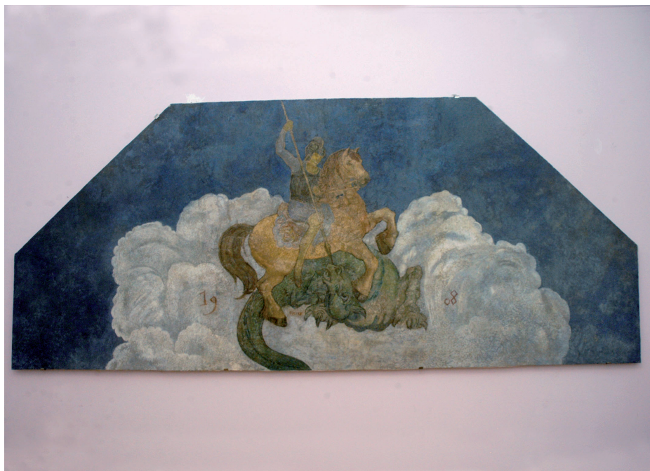
Slika 37. Sv. Juraj ubija zmaja, djelo slikara Miroslava Kraljevića, Gradski muzej Požega

dijeljena za predloženi program. Program kojim bi se freska Miroslava Kraljevića spasila i pohranila u Gradski muzej Požega predložio je Ferdinand Meder, ravnatelj Hrvatskoga restauratorskog zavoda.