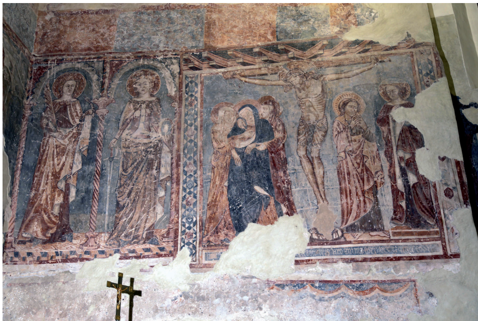
Slika 10. Raspeće, scena na južnom zidu glavne lađe crkve sv. Lovre