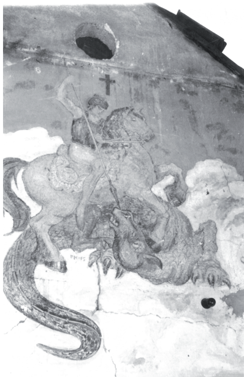
Slika 36. Sv. Juraj ubija zmaja, scena u zabatu vinogradarske kuće u Požezi, 1960.g., slikara Miroslava Kraljevića.

dine darovao Gradskom muzeju Požege, ali pod uvjetom da se slika sa zida skine i izloži u muzeju. Nakon njegove smrti supruga Luca i djeca predali su sliku koju su sa zabata kuće skinuli, restaurirali i izložili kao štafelajnu sliku restauratori HRZ-a iz Zagreba 30 u prostoru požeškog muzeja do izlaganja u novom stalnom muzejskom postavu. 31 Freska je financirana sredstvima Ministarstva kulture koja su HRZ-u do-