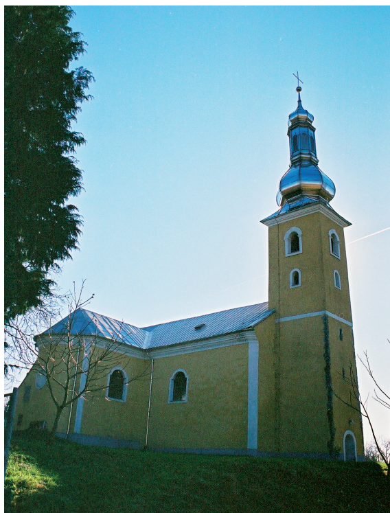
Slika 21. Crkva Svih Svetih u Sesvetama

Svi sveti , na kojoj su prikazani u dinamičnoj dijagonalno-križnoj, baroknoj kompoziciji Bog Otac, Sin i golubica Duha Svetoga nad njima. Podno tih likova jest prikaz Bezgrešnog začeca, Blažena Djevica Marija koja gazi zmiju. Jednom rukom Isus je pridržava, a drugom, na koju mu je naslonjen križ, Mariji stavlja krunu na glavu. Nad svima njima odozgo bdiju Bog Otac i golubica Duha Svetoga. Od sredine dolje oko nje su mjesec i anđeli. Cijela kompozicija naslikana je unutar romba, koji umjesto kuteva ima lukove, tako da cijeli okvir izgleda poput stiliziranog cvijeta.