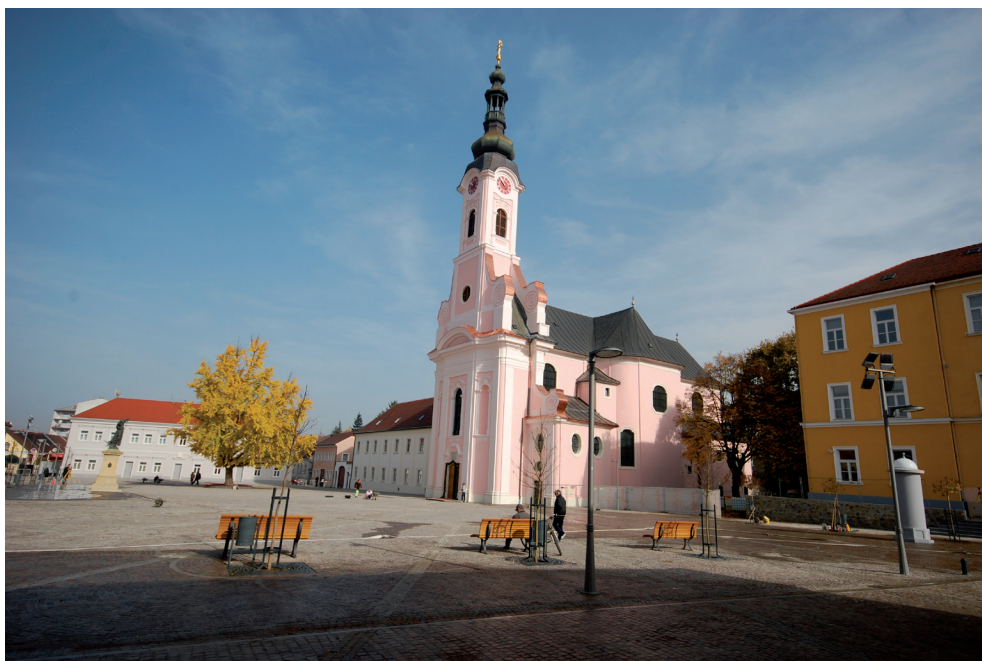
Slika 27. Katedrala sv. Terezije Avilske

Iako se držalo da su slike u toj kapeli površne, pa se zbog toga nije angažirao slikar Antonini, vjerojatno je župnik Antun Mikulić želio tada za oslikavanje crkve najbolje slikare. Ostvarivanje te želje, kao Požežaninu, omogućio mu je dobar odnos s Gradom i župljanima, koji su za posao angažiranih poznatih hrvatskih slikara Otona Ivekovića i Celestina Medovića vjerojatno osigurali veći iznos sredstava, te je oslikavanje crkve, danas katedrale, nastavljeno. (sl. 27)