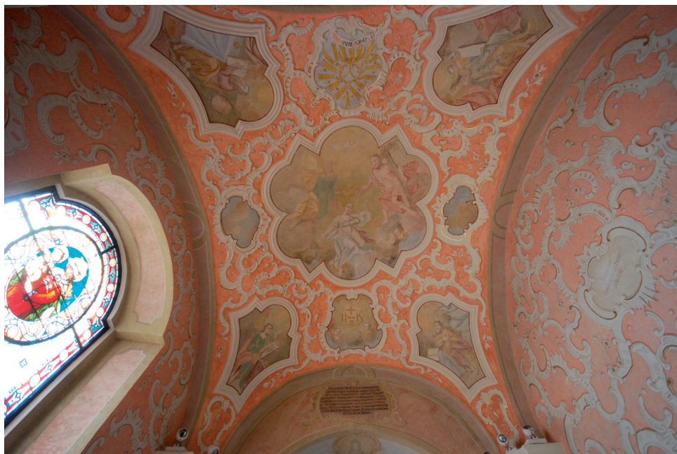
Slika 20. Freske na svodu svetišta u crkvi sv. Mihovila u Stražemanu

Suprotno kristogramu, u baroknom štuko okviru pozlaćenim slovima ispisano je ime Djevice Marije .