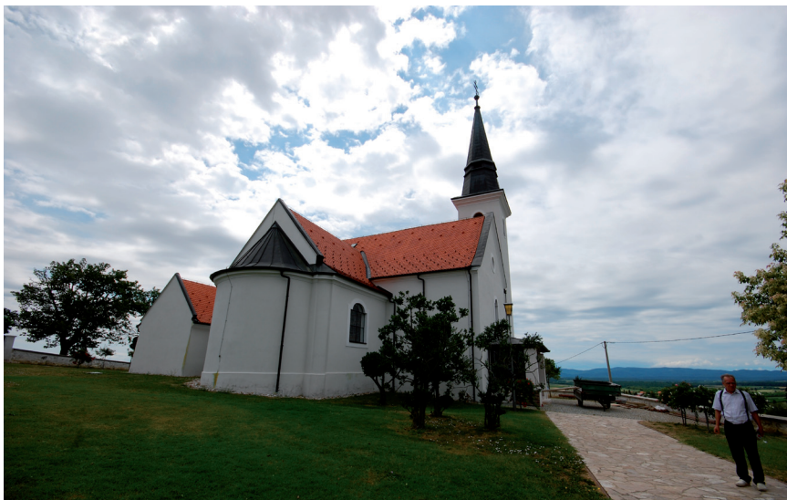
Slika 18. Crkva sv. Mihovila u Stražemanu