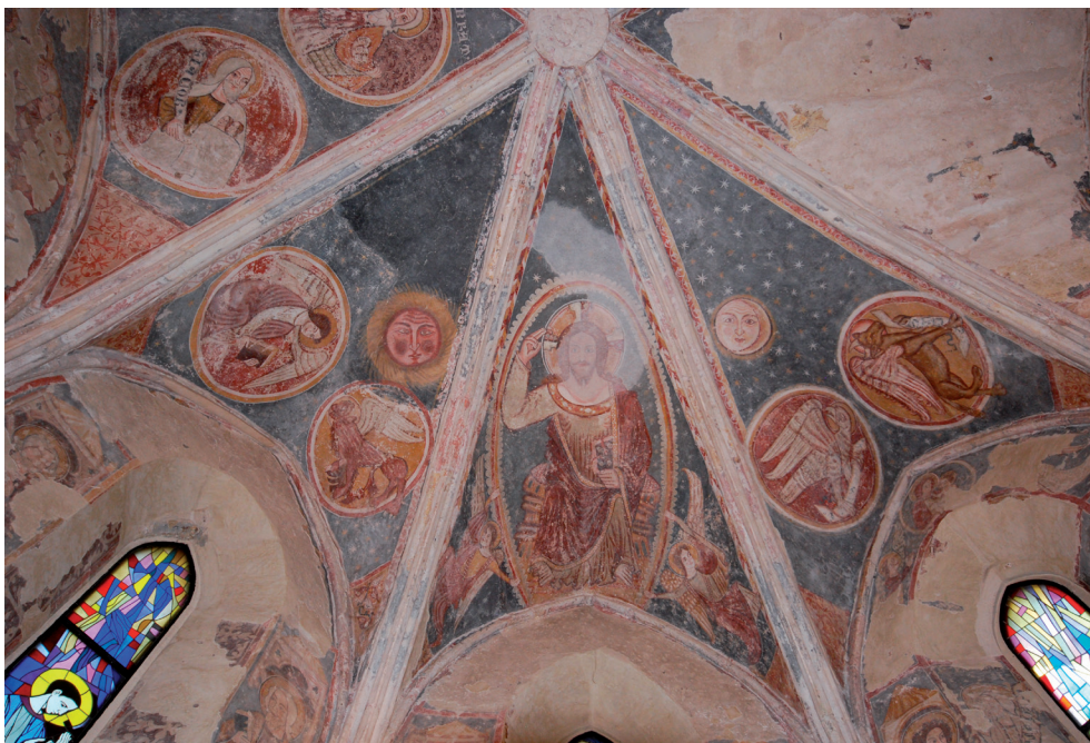
Slika 9. Freske na svodu svetišta u crkvi sv. Lovre

3. Sv. Matej i sv. Marko, evanđelisti , simbolično prikazani kao andeo i lav , nalaze se svaki u jednom medaljonu. U polju je prikazano i Sunce . Scene se nalaze u sjeveroistočnom bočnom polju.