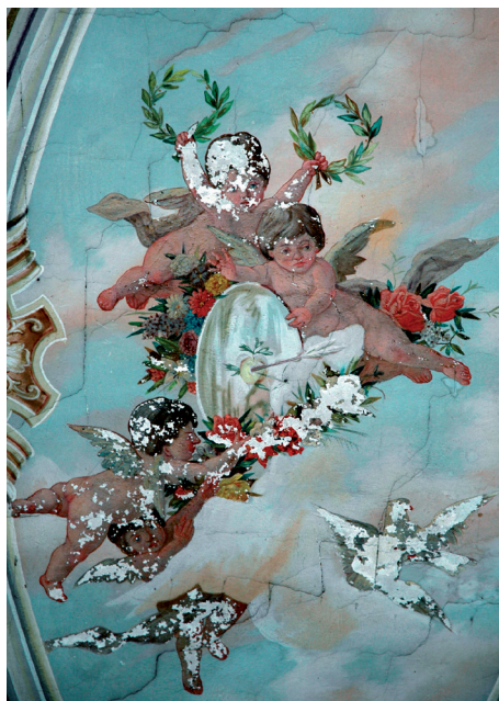
Slika 34. Anđeli u slavlju, scena na stropu kuće dr. Franje Arha u Požegi

Zidna slika SV. JURAJ UBIJA ZMAJA akad. slikara Miroslava pl. Kraljevića na zabatu vinogradarske kuće obitelji Kraljević