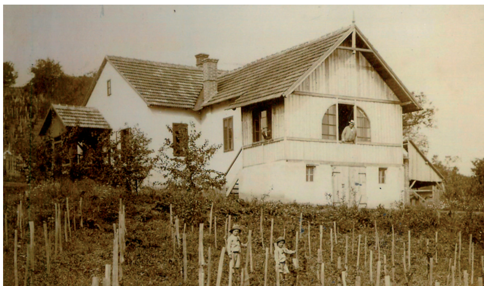
Slika 35. Vinogradarska kuća Ladislava Kraljevića na brdu Đurđevac u Požegi