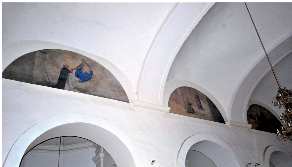
Slika 24. Zidne slike Marka Antoninija u franjevačkoj crkvi Duha Svetoga

U lunetama na sjevernom zidu glavne lađe naslikane su tri slike koje se odnose na evanđelja: