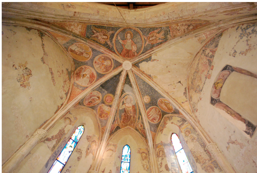
Slika 3. Freske na svodu svetišta u crkvi sv. Lovre

U vrijeme 150-godišnje vladavine Osmanlija, koji su 1537. godine potpuno osvojili požeški kraj, dio crkava je srušen, dok je drugi dio pretvoren u džamiju, a zidne su slike prekrivene žbukom.