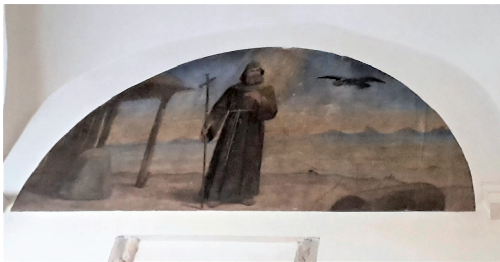
Slika 25. Sv. Antun Pustinjak, zidna slika slikara Marka Antoninija u franjevačkoj crkvi Duha Svetoga

Osim prethodno navedenih zidnih slika u glavnoj lađi franjevačke crkve Duha Svetoga, Marko Antonini u Požezi je već 1877. godine izradio pozornicu za otvaranje nove zgrade Gimnazije (danas Katoličke gimnazije). U to vrijeme bio je poznati ne samo slikar nego i scenograf. Posebno je zanimljivo da je Marko Antonini pozornicu za Požešku gimnaziju radio dvije godine nakon što je oslikavao dvorac u Oroslavlju i slike na Trsatu za grofa Artura Nugenta te dekoracije za staro kazalište na Markovu trgu u Zagrebu (1888.).