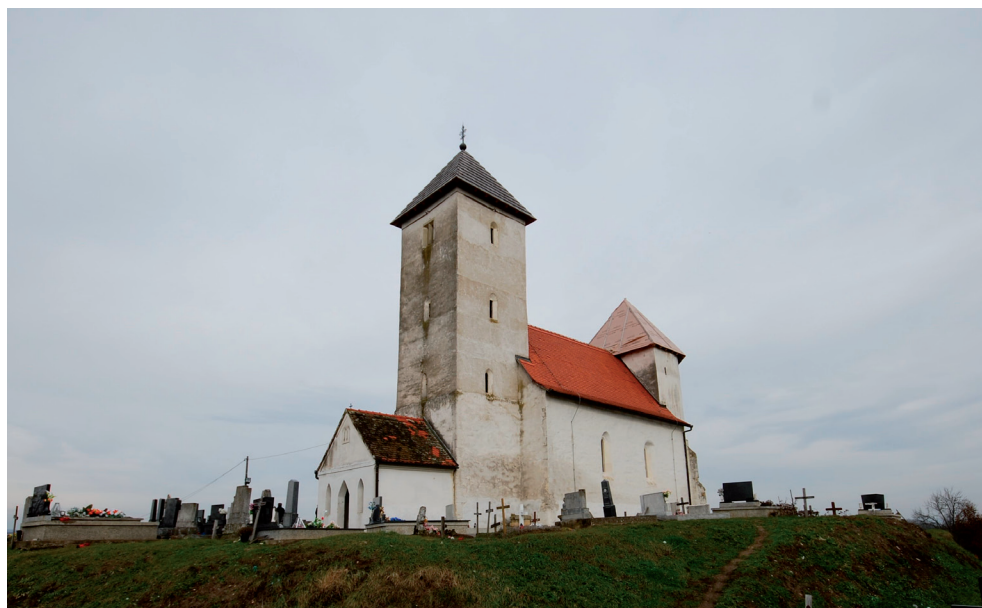
Slika 14. Crkva sv. Dimitrija u Drenovcu

Posjed Drenovac zajedno s tvrđom u Drenovcu 1310. godine Karlo Robert, hrvatski i ugarski kralj, darovao je Pavlu Gorjanskom. Kao naslijeđe Nikola Gorjanski 1410. godine darovao ga je svojoj supruzi Ani, kćeri Nikole Veličkog. Vlasnicima posjeda godine 1470. postaju plemići Berislavići Grabarski, koji s vlasnikom Velike Đurom Bekefyjem potpisuje sporazum kojim se utvrđuje pravo da po izumiranju jedne porodice ova druga nasljeđuje njezine posjede. Sporazum je proveden 1489. godine, kada je samostan križara Ivanovaca, po nalogu kralja Matije Korvina, uveo Berislaviće Grabarske u posjede Bekefyja Veličkih. (Jelavić, 2016). Za slikarstvo drenovačke crkve (i veličke) vjerojatno su bili presudni utjecaji plemićkih obitelji s toga