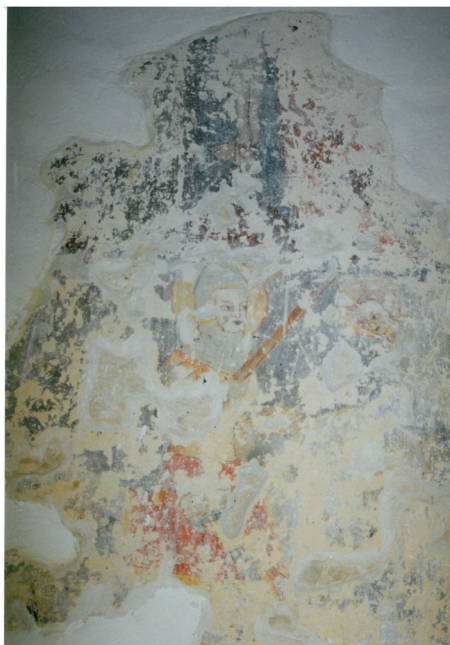
Slika 15. Vitez na konju s kopljem, scena u svetištu crkve sv. Dimitrija u Drenovcu

Središnji dio sjeverozapadnog zida svetišta , koji je najbolje očuvan, oslikan je scenom Poklonstva kraljeva, od koje su ostali fragmenti. Prizor Poklonstva kraljeva predstavlja klanjanje Kristu kao „Kralju kraljeva“ i klanjanje njegovoj božanskoj naravi dok kao Dijete sjedi u krilu Blažene Djevice Marije, koja se jedva nazire. Na krilu drži dijete Isusa. Lijevo se nazire lik sv. kralja Baltazara koji Djetetu pruža kalež (ciborij) sa smirnom. On kleči pred Djetetom i Majkom. Sv. kralj Melkior Djetetu pruža krunu, ali je ono ispušta pružajući ruke prema kaležu sa smirnom koji simbolizira pomazanje prije smrti. Scena je sačuvana u fragmentima. Posudu s tamjanom Djetetu daruje sv. kralj Gašpar. Posuda predstavlja liturgijski predmet u kojem je naglašen sakrament euharistije i misa, a simbolizira duhovni život koji ukazuje na Nebo. Cijela scena poklonstva prikazuje se na kasnogotični, narativan, slikovit i simboličan način. (sl. 15)