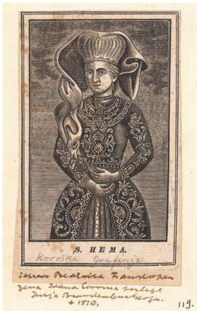
6. S. HEMA, [Koroška grofinja], 1839. Zagreb, Hrvatski državni arhiv, Grafička zbirka

ST HEMMA, [Carinthian Countess], 1839, Zagreb, Croatian State Archives, Graphic Collection