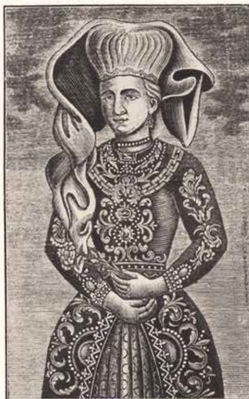
S. HEMA. Koroska Grofinja

5. S. HEMA, Koroska grofinja , oko 1839., Zagreb, Hrvatski državni arhiv, Grafička zbirka