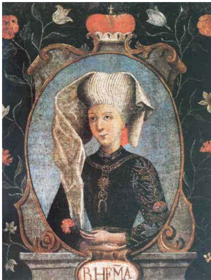
8. Sv. Ema Krška (Hl. Hemma von Gurk), sredina 18. stoljeća. Privatna zbirka. Iz knjige Antona Fritza, Das große Hemma-Buch (1980.) St Emma (Hl. Hemma von Gurk), mid-18 th century, private collection (Source: Anton Fritz, Das große Hemma-Buch (1980))

der Hemma-Hut ), zapravo jedan od najstarijih sačuvanih srednjovjekovnih hodočasničkih šešira, ipak nešto mlađi od Emina vremena. 31 Bliska kopija Portreta Beatrice Frankapan (?) objavljena je na bakrorezu (sl. 7), 32 tiskanu sredinom 18. stoljeća. Svetica je prikazana poprsjem, ali ovdje sklapa ruke na molitvu pred rastvorenim molitvenikom oslonjenim na lubanju. Prizor je proširen krajolikom s ključnim pripovjednim prikazima iz Emine hagiografije, potom vedutom katedrala u Krki (gdje je sv. Ema Krška pokopana) i drugim motivima, poput dekoracije svetičina groba u kripti (Antonio Corradini, 1720.–1721.). Austrijski povjesničari umjetnosti taj tip prikaza sv. Eme Krške, koji se oslanja na madridski Portret Beatrice Frankapan (?) zovu Frangepani-Typus . 33