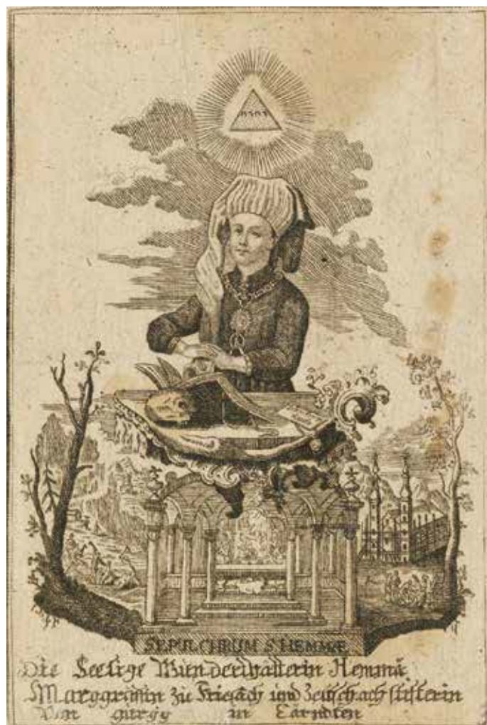
7. Sv. Ema Krška (Hl. Hemma von Gurk), sredina 18. stoljeća. Celovec / Klagenfurt, Zemaljski muzej za Korušku

ST HEMMA, [Carinthian Countess], 1839, Zagreb, Croatian State Archives, Graphic Collection