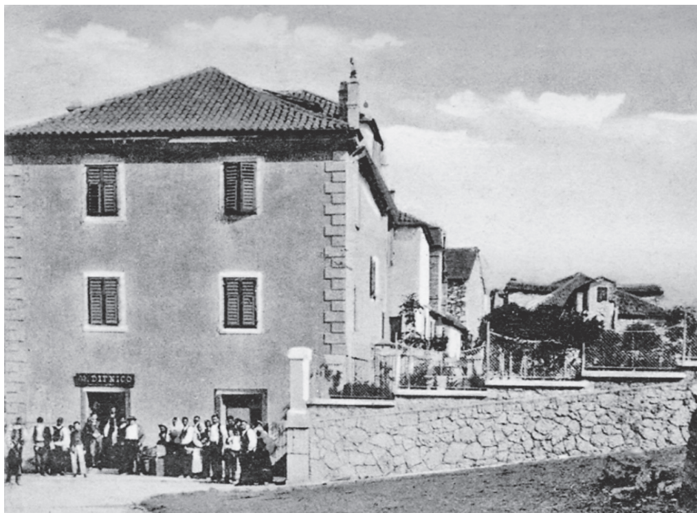
Slika 2: Sklop kuća Divnić početkom XX. st.