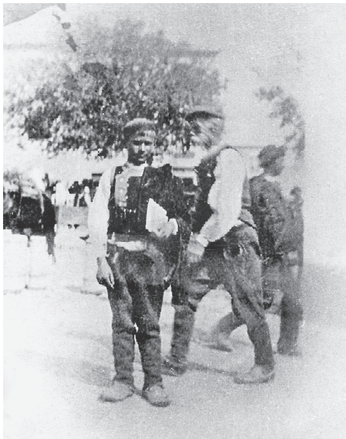
Slika 7: Ivan Meštrović s Kačićevom, 1898.g.