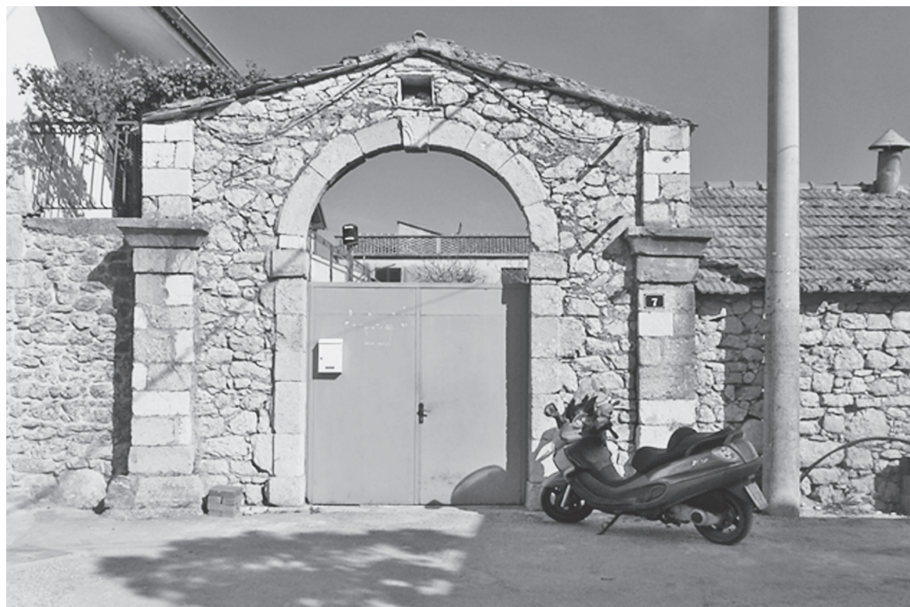
Slika 1: Barokni portal sklopa Nakić-Vojnović