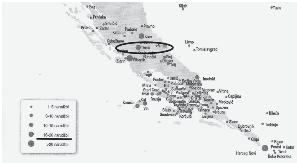
Slika 9: Isječak karte s podcrtanim brojem kupaca knjiga u Drnišu između 1902. i 1916. g. u splitskoj knjižari Marpurgo