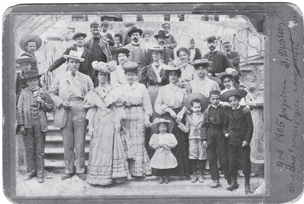
Slika 6: Uspomena na proslavu 90. godišnjice Pučke muške škole u Drnišu, 1905. g.