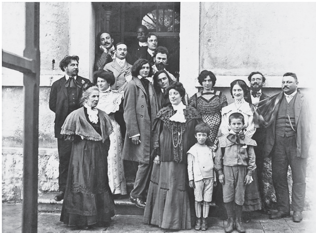
Slika 8: Ivan Meštrović s društvom u Drnišu pred Općinom, Pjesmaricom u ruci, Drniš, 1906.g.