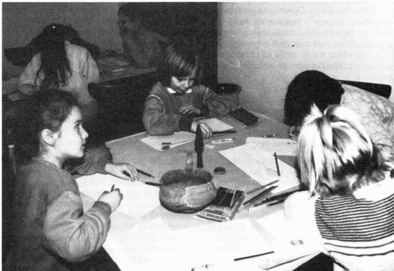
Sl. 1 — Crtanje u muzejskoj učionici

priliku visio na zidu predavaone te putem nekoliko dijapozitiva projiciran tokom razgovora. Najviše zanimanja kod djece su pobudili originalni arheološki nalazi koji su stajali na stolovima, nadohvat ruke, pa su se mogli detaljno razgledati, opipati. Na kraju razgovora ponovljeni su ključni termini. Djeci su podijeljeni radni listići pripremljeni za ovu temu te im je objašnjeno na koji način će ih kod kuće ispuniti. U glavi listića nalazi se prostor u koji dijete upisuje osobne podatke (ime, prezime, razred i škola), zatim slijedi nekoliko pitanja na koja se odgovara dopunjavanjem riječi, odabirom jednog od predloženih odgovora, rješavanjem jednostavne križaljke te izrezivanjem i lijepljenjem na određeno mjesto sličica onih predmeta koje arheolog najčešće nalazi u svojim istraživanjima. Ovu domaću zadaću djeca su shvatila kao razonodu i igru, no njome su ipak utvrđeni određeni pojmovi, potaknuto je razmišljanje i logično rasuđivanje. Uz obradu teme vezan je i kreativni rad učenika koji su slijedećeg dana u istom prostoru crtali pojedine arheološke nalaze - one iste koje su dan ranije imali prilike upoznati i temeljito pregledati (sl. 1). Crtaće kartone pripremili smo i označili u