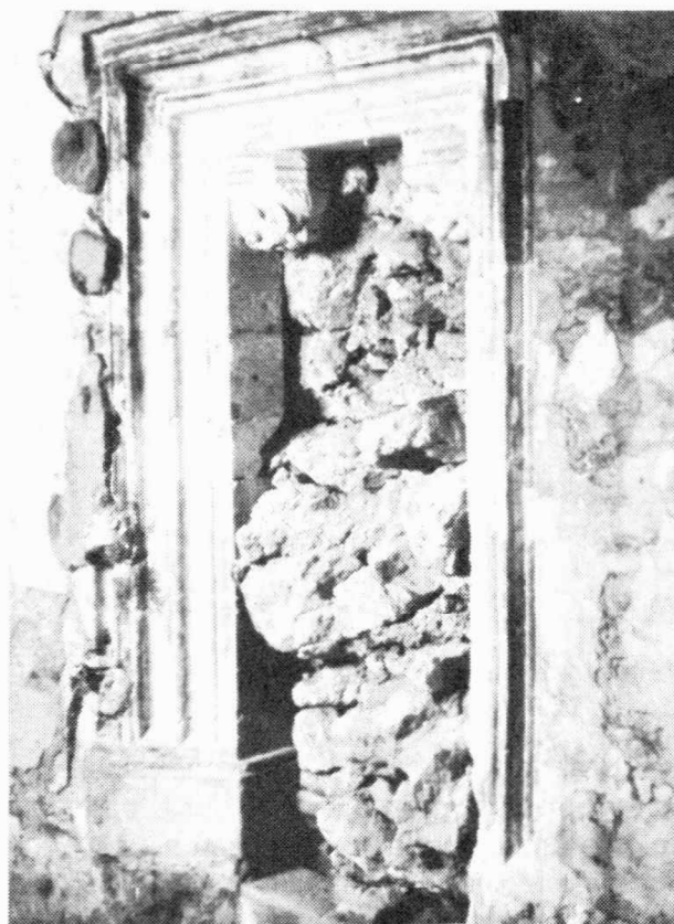
1 - Sjeverni portal Lepoglavské crkve, stanje 1991.

Pojava reduciranog 5 , gotovo simboličkog prikaza Posljednjeg suda na sjevernom portalu lepoglavске crkve posredni je dokaz da se zaista radi o glavnom i jedinom ulazu za vjernike u crkvu. Koliko se dugo takvo stanje održalo, ne znamo i ne možemo znati bez potpune arheološke slike o zapadnom pročelju. Lako je moguće da je već koncem 15. stoljeća sa zapadne strane otvoren novi portal, budući