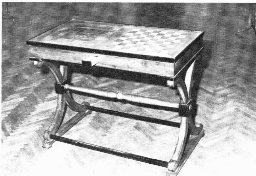
Sl. 2 Stolić za igranje šaha, dame i tiktracka

drvenih prečki. Rezbarija je svedena na malu mjeru, a pojačava se u kasnijem razdoblju. Ponekad se izvodi diskretan ukras paljenim crtežom.