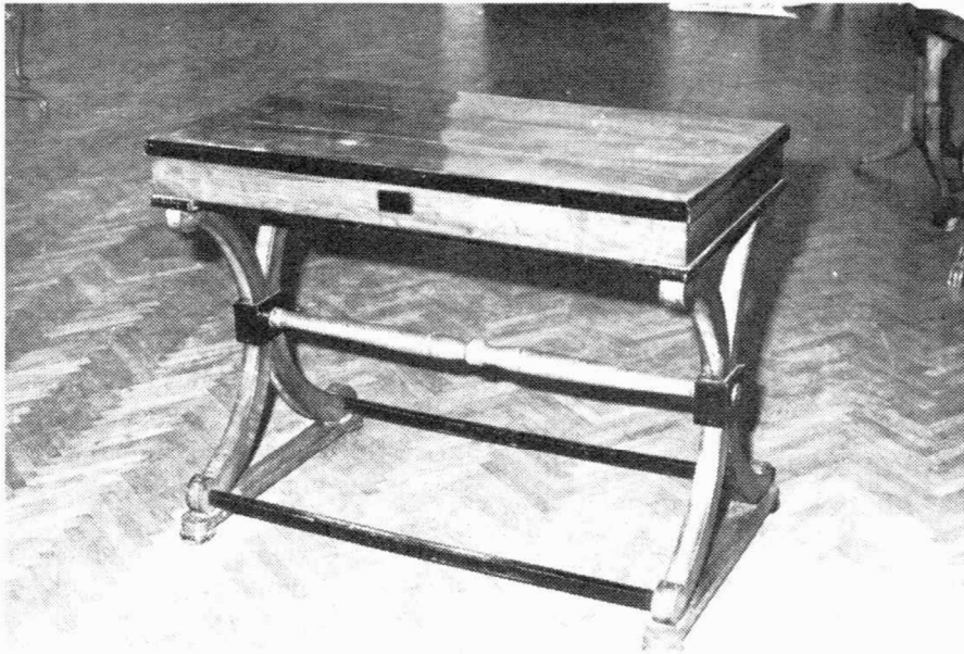
Sl. 1 Stolić za igranje šaha, dame i tiktracka

Kao i sam stambeni prostor, tako i namještaj toga doba karakteriziraju jednostavnost, praktičnost i udobnost. Svaki komad ima svoju namjenu i određeno mjesto ali, prema potrebi, može se razmještati po sobi. Za razliku od baroknog ambijenta gdje je namještaj bio isključivo poredan uza zid da ne bi narušavao apsolutnu simetriju koju je ukus