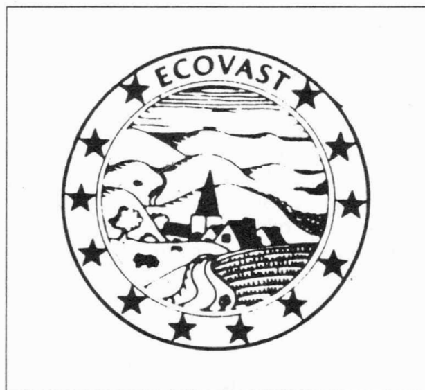
Znak ECOVAST- a

Ovaj broj "Radova" Instituta za povijest umjetnosti obiluje fotografijama s održavanja znanstvenog skupa i obilaska terena, te fotografijama arhitektonskog naslijeđa o kojemu je bilo riječi u prikazanim referatima.