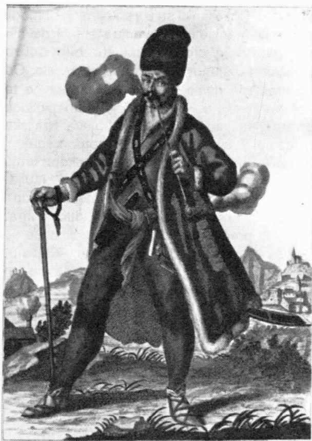
Ein Officier unter der Varasdiner Infanterie. Mit was für Gravitet raucht dieser nicht Coback Man nach dem Experieren er sich erwidert befund! Gehst er dan vor den Feind, steht er nicht in den Sack Die Hand, so jederzeit dann fechten fertig sind