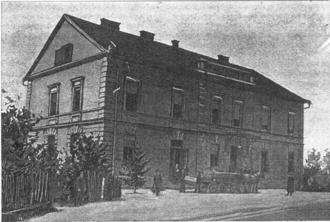
Sl. 1 — Medimurska tvornica šampanjca 1905. godine

oko 15 000 forinti. Vrijednost žitarica bila je gotovo deseterostruko manja. Vino je, više nego očito, donosilo najveće prihode. 3