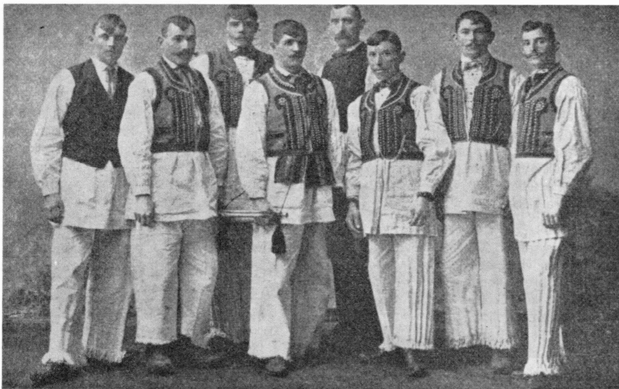
Sl. 1 — Hrvatski seljaci, učesnici narodnog pokreta 1903.

je šazivanje skupština u cijeloj Hrvatskoj) a nakon toga kad Khuenova vlada silom zabranjuje održavanje skupština kao "revolucionarna" faza (demonstracije, skidanje mađarskih zastava i natpisa, navale na željezničke stanice i pruge, kidanje telefonskih žica, napadi na mađarske posjede i dr.).