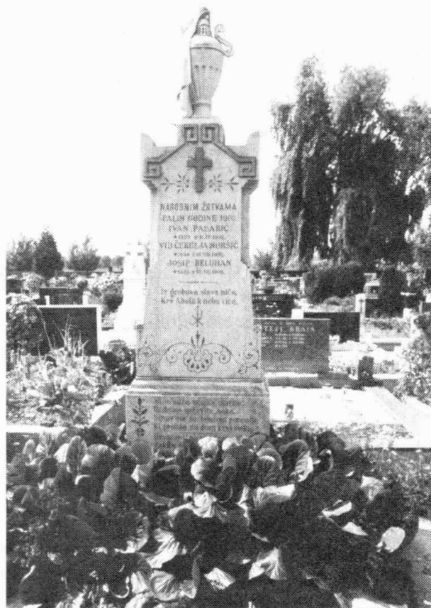
Sl. 2 — Spomenik žrtvama 1903. na groblju u Brdovcu

Dok su se učesnici travanjskih događaja nalazili još većinom u tamnici, odluka vlasti da se na rođendan Franje Josipa 18. kolovoza na svim željezničkim stanicama u Hrvatskoj i Slavoniji izvjesi zajedno mađarska i hrvatska zastava izazvala je novu nesreću u Zaprešiću. Zajedno sa zastavom stiglo je u Zaprešić šest oružnika kao pojačanje četvorici domaćih. Vijest o ponovnom izazovu s mađarskom zastavom brzo se proširila čitavim krajem; oko 9 sati obratilo se 30 općinara telegramom samom banu s molbom da dade skloniti zastavu radi mogućih nemira, do 10 sati skupilo se oko stanice do 1 000 ljudi koji su došli mirno i goloruki jedino s namjerom da traže skidanje zastave ili da je sami skinu ako ih se ne poslušaju. U tvornici u Savskom Marofu bio je prekinut posao, radnici su ostavili sve i pohrlili prema Zaprešiću. Napetost na stanici se povećavala; kad je popustio kordon oružnika koji su čuvali stanicu došlo je do komešanja, gužve i sukoba. U tom komešanju popela se na ksten uz krov zgrade trinaestogodišnja Jelica Jug, sestra vatrogasnog trubača