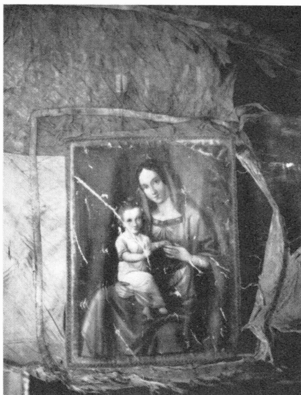
Sl. 3 — Županijska zastava iz 1848. god. strana B

Sve tri opisane zastave mađene su u županijskoj zgradi na Franjevačkom trgu u Varaždinu, odakle su 1925. prenešene u Stari