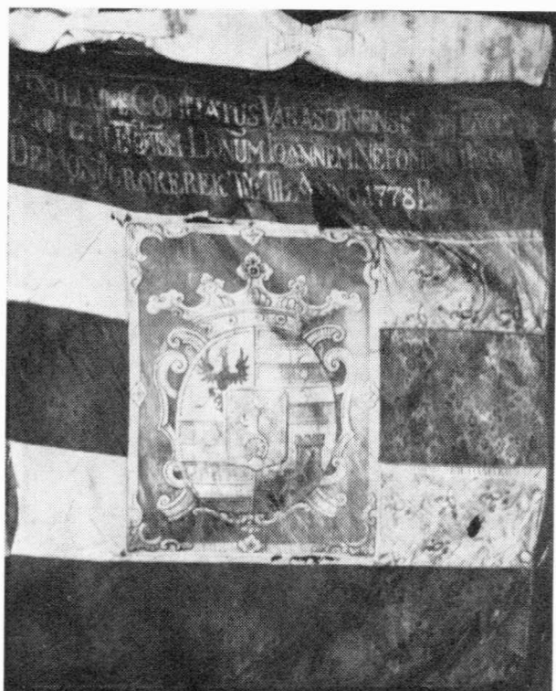
Sl. 1 — Najstarija zastava Županije varaždinske iz 1778. god. strana A

ERECTUM. S druge B strane: slika je Bogorodice s malim Isusom. Drvena motka zastave bojena je spiralno crveno-bijelo, duž. 262 cm s mjedenim šiljkom na vrhu. Uz šiljak je vezenka od bijelog morea, s metalnim resama na oba kraja, duž. 102 cm. 2 Ova opisana zastava je ujedno i najstarija zastava Županije Varaždinske i nekada je visila u županijskoj dvorani. Kao što se vidi i na slici zastava je jako oštećena i hitno ju treba restaurirati. (Sl.1)