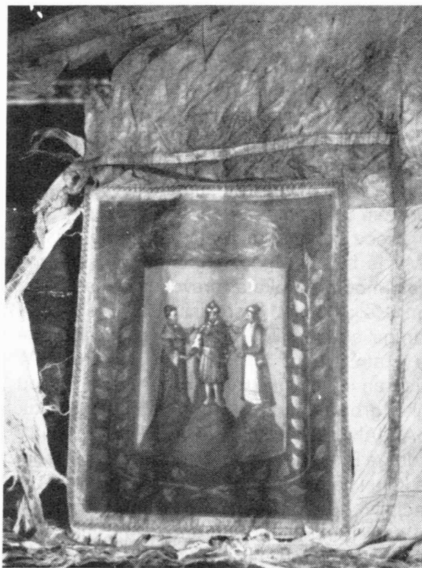
Sl. 2 — Zastava Županije varaždinske iz 1848. god. strana A

Varaždinskoj županiji dodijelila je grbovnicu 1763. god. i ona se danas čuva u Historijskom arhivu u Varaždinu. Ovim kraljičinim aktima dobile su županije poseban grb, odnosno pečat i pravo uporabe crvenog pečatnog voska. Kod podjele grbova hrvatskim županijama stavljene su heraldičke figure iz grbova pojedinih obitelji, čiji članovi su obnašali čast župana u dotičnoj županiji. Tako je Varaždinskoj županiji podijeljen grb obitelji Erdödy, koji su bili