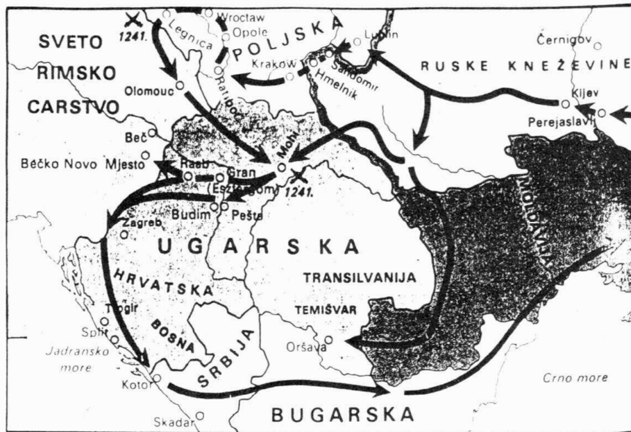
Sl. 1 (po Thimesovom Atlasu svjetske povijesti)

IV 17 postalo je potpun promašaj. Umjesto ostvarenja ovoga cilja tatari su dočekali jednu drugu vijest, za njih kobnu.