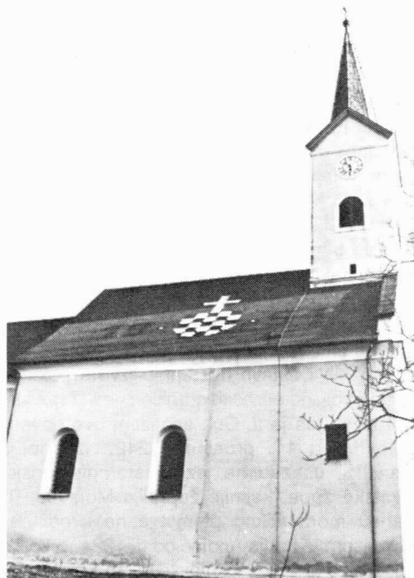
Sl. 2 — Crkva Sv. Trojstva u selu Moravče Moravča.

Naveli smo, da se prvi puta ime Moravča javlja u dvije povelje iz 1242 godine, jednu, onu iz Virovitice, od 11. prosinca smo analizirali. Druga, izdana u Zagrebu (datum nema) u kojoj Zagrebački Kaptol vrši ulogu izmiritelja u sporu između rodova Andrije i Junoše (...Andreas cum tota generacione sua ex una parte, necnon Jonusa eodem modo...) zbog posjeda (pro terra MOSOCHA) Moravče. 32 Kod opisa ovih posjeda (terra) spominje se i riječica Sucha mosocha (ad fluvium qui vocatur Sucha mosocha). Ako je Mosocha moravče, onda je, per analogiam, Sucha mosocha potok Moravče (fluvium Moraucha), pa nam i ova povelja određuje dio istočne granice Moravča.