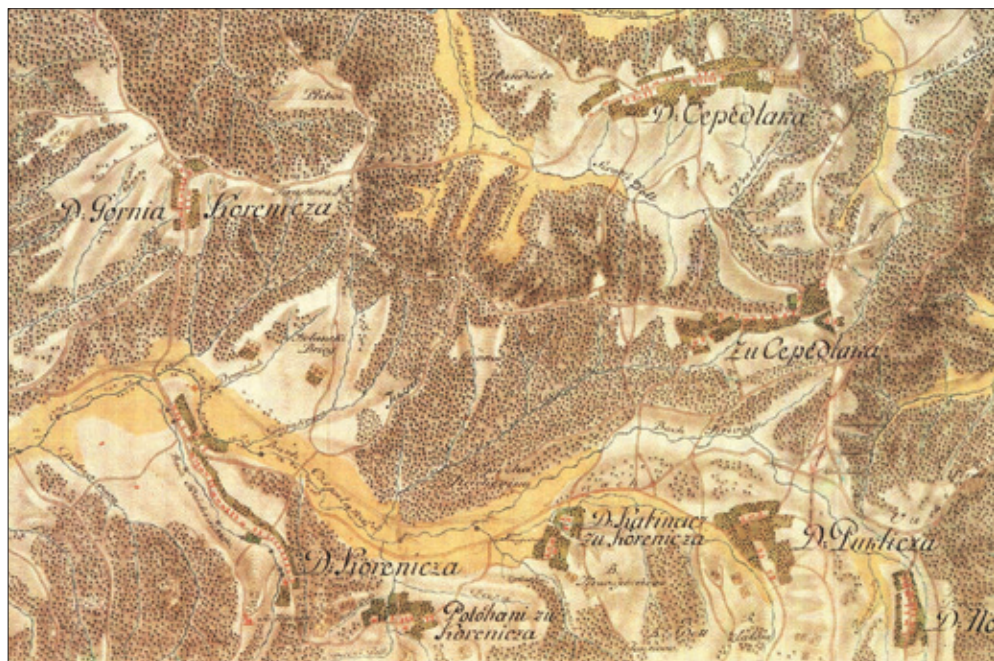
Slika 6. Zemaljske ceste za Viroviticu (preko Cjepidlaka) i Požegu (preko Koreničana) na I. vojnom premjeravanju (1781-83),

Hrvatska na tajnim zemljovidima 18. i 19. stoljeća, 6: Požeška županija, Hrvatski institut za povijest, Zagreb 2002