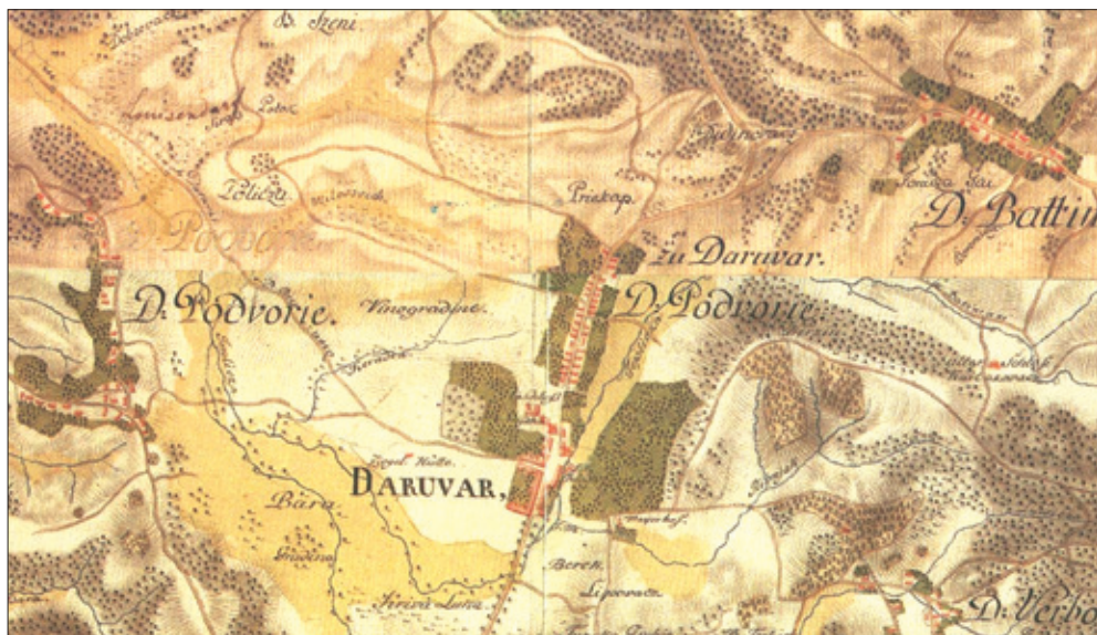
Slika 1. Daruvar i okolica na I. vojnom premjeranju (1781-83), Hrvatska na tajnim zemljovidima 18. i 19. stoljeća, 6: Požeška županija, Hrvatski institut za povijest, Zagreb 2002

može dvostruko produžiti. Koliko je bila važna opasnost od kuge, daje naslutiti podatak da se izbjegavanje karantene kažnjavalo smrću. 378