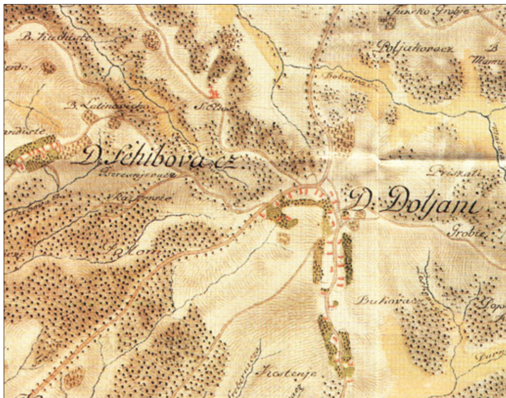
Slika 4. Doljani, lokacija stare crkve na I. vojnom premjeravanju (1781-83), Hrvatska na tajnim zemljovidima 18. i 19. stoljeća, 6: Požeška županija, Hrvatski institut za povijest, Zagreb 2002

mjerno veliko trgovište s ruševnom utvrdom u središtu (na mjestu današnjeg dvorca). Oko tvrđave oformljen je prostran trg, iz kojega je dijametralno izlazilo nekoliko ulica, povezanih okomitim sokacima, a u sjeverozapadnom dijelu bio je današnji franjevački samostan s crkvom. Sama povijesna jezgra Virovitice razmjerno je velika, složene strukture s vjerojatno srednjovjekovnim reliktima te zaslužuje posebnu obradu.