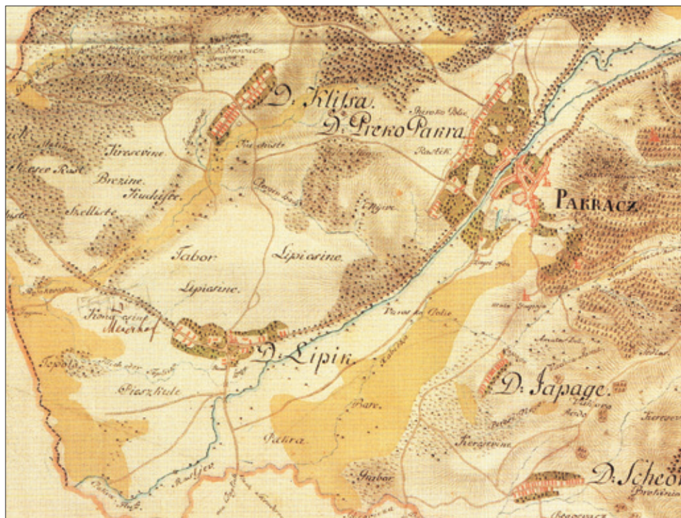
Slika 2. Lipik i Pakrac na I. vojnom premjeravanju (1781-83), Hrvatska na tajnim zemljovidima 18. i 19. stoljeća, 6: Požeška županija, Hrvatski institut za povijest, Zagreb 2002

dužinu, sve do križanja s ulicom M. A. Reljkovića. Na njezinu su južnome kraju ucrtane čak dvije crkve. Manja od njih nalazila se očito na groblju uz današnju Reljkovićevu ulicu, a veća na samome križanju, gdje je danas prazan prostor, a na karti stabilnog katastra (1857.) 380 isto tako je ucrtano groblje. Zanimljivo je da se oba groblja nalaze na području katastarske općine Čovac, što znači, tada de facto izvan Okučana.