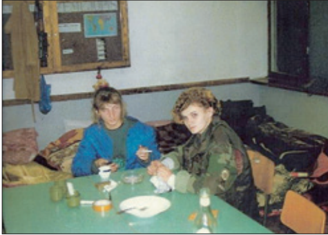
Fotografija 6. Dvije Jasne u učionici povijesti 1991. SŠ Bartola Kašića Grubišno Polje

Fotografija 7. Lado Lekčević