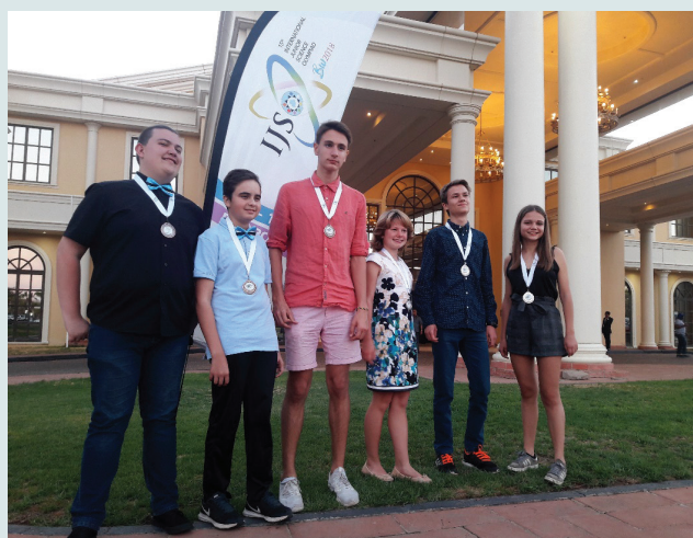
Slika 1 – Učenici nakon dodjele medalja na 15. Međunarodnoj prirodoslovnoj olimpijadi mladih održane u prosincu 2018. u Gaboroneu, Bocvana

Nakon testiranja i odabira učenika organiziraju se pripreme za natjecanje na Kemijskom, Biološkom i Fizičkom odsjeku PMF-a Sveučilišta u Zagrebu (slika 2). Prirodoslovno-matematički fakultet je uz financijsku potporu Ministarstva znanosti i obrazovanja organizirao izbor, pripreme i sudjelovanje na olimpijadi. Na pripremama koje su trajale šest dana učenici su svladali osnovne tehnike rada u laboratoriju, pripreme uzoraka, planiranja pokusa, postavu uređaja, prikupljanja i obrade podataka te njihove analize i interpretacije. U pripreme je uključen i teorijski dio iz područja koja se ne nalaze u školskim programima, a sastavni su dio silabusa Olimpijade.