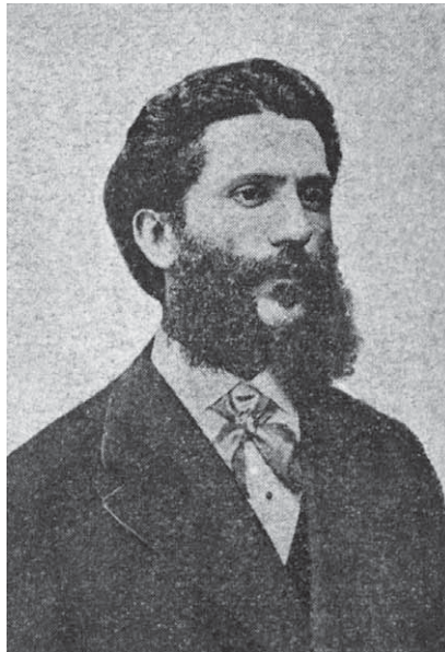
Slika 6. Antonio Gosetti 84

niziran upravo u njegovu čast. 79 Prema izvorima, Gosetti se kao značajniji pjevač pojavio prvi put na koncertu u rujnu 1863, 80 kada je uz Šimu Strmića, Carlottu Bianchi i Rodolfa Nejbseja pjevao završni zbor Perijeve opere Vittor Pisani , 81 a na Novogodišnjem koncertu iste godine Il Nazionale ističe Gosettija kao glavnu zvijezdu koncerta. 82 Više od dvadeset godina Gosetti je pjevao na svakom koncertu Filharmonije i to ponekad duete, tercete, a najčešće solo brojeve. Sabalich piše o njemu da je djelovao četvrt stoljeća te da je: »genialissima figura del nostro piccolo orizzonte musicale cittadino«. 83