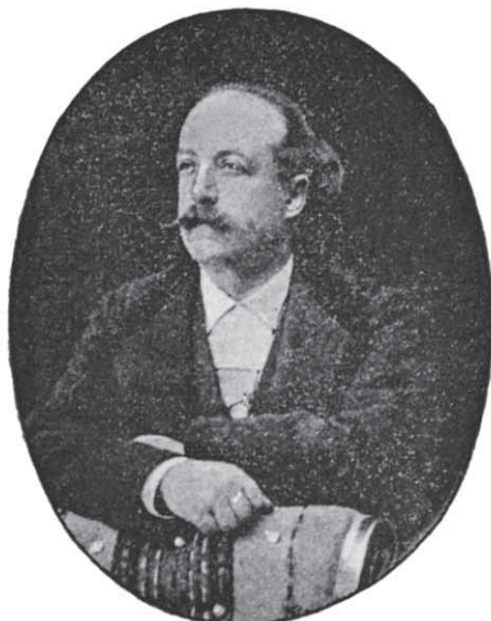
Slika 13. Rocco Zanghi 127

Iako nije bio stalni član zadarske Filharmonije, poznati zadarski pjevač sa svjetskom karijerom, bariton Rocco Zanghi , nastupao je kao njihov gost na koncertu 1862, na kojemu je pjevao i ugledni tenor Mazzoleni. Tom je prilikom Zanghi pjevao recitativ i cavatinu iz Donizettijeve opere Lucrezia Borgia i duet iz Verdijeva Trubadura s Carlottom Bianchi. Još kao mladić Zanghi je učio pjevanje prvo kod G. Cigale, a zatim kod A. Ravasija. Očito ohrabren podrškom uglednoga kritičara Salghetti-Driollija, otišao je u Ameriku i tamo stekao slavu. O svjetskim uspjesima Zanghija saznajemo iz korespondencije Salghetti-Driollija i njegova prijatelja skladatelja L. Riccija koji je za njega imao samo riječi hvale. 125 Zanghi je i prije osnutka Filharmonije djelovao u Zadru, pa ga lokalne novine spominju već 1840-ih i 1850-ih, a nakon toga pretpostavlja se da djeluje uglavnom u inozemstvu. 126