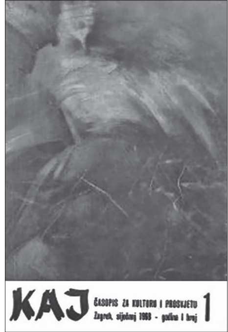
Naslovnica 1. br. Kaja (Z. Drempetić Hrčić: “Klasje”)

“Malo je umjetnika čiji je slikarski svijet tako duboko obilježen mjestom rođenja kao Drempetiće. U tišini svoje regije Zorislav Drempetić Hrčić desetljećima stvara idealnu sliku svijeta usuprot novim avangardnim trendovima, pa se njegovo djelo ponajviše pamti po čudesnoj vizionarnosti zavičajnog prostora. Sagledavajući njegov prijedeni put sažeto su prikazane najvažnije, iako ne i sve, faze i preobrazbe kojima je Drempetić prolazio, od najranijih djela, na koja se gotovo posve već zaboravilo, do najnovijih radova nastalih ove godine. Ta njegova razvojna linija vrlo je složena i premda naoko kontroverzna ona je logična, na što se ovim prikazom jasno potvrdilo. Drempetić ne bi bio istinski suvremenik druge polovine dvadesetog stoljeća da je propustio sudjelovati u pojavama koje su vrtoglavo mijenjale smjerove tradicionalnog slikarstva. Nastanivši svoje najranije slike halucinantnom motivikom, on se zapravo angažirano referirao na suvremenu zbilju. Potom su uslijedila apstraktna okušavanja. Samosvojnost koja ga je obilježila od samih početaka dala je autentični biljeg i toj ranoj apstraktnoj dionici, koja se uobličila na motivima zavičajnoga kraja i na nostalgичnim sjećanjima na oronule zidove starih zagorskih dvoraca i kurija što ih je pamtió još